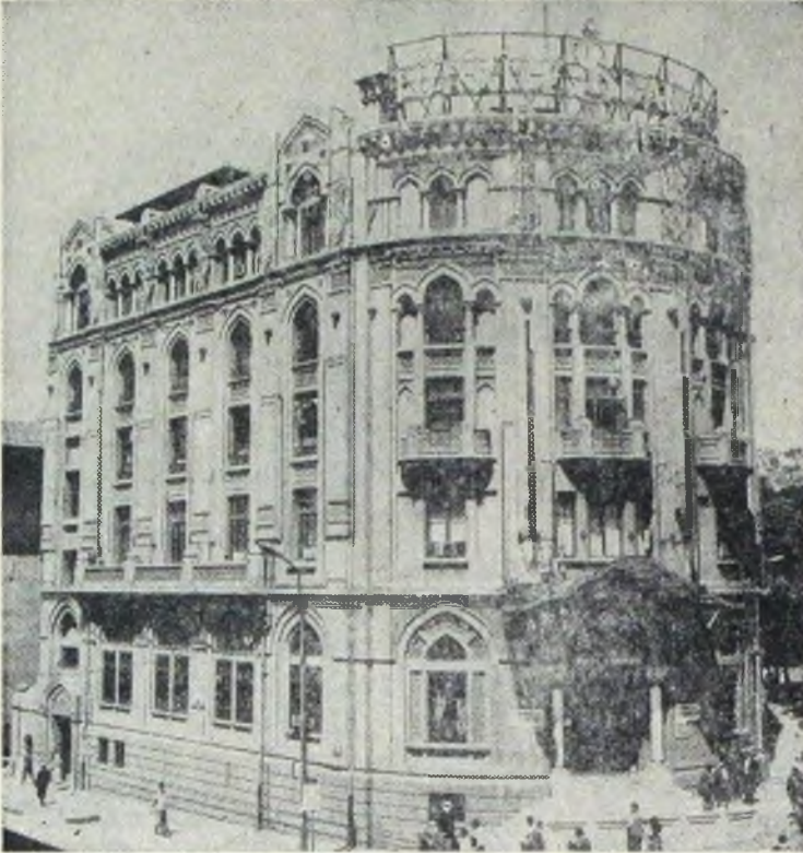
Umum Müdürlük - Ulus Meydanı (Ankara)