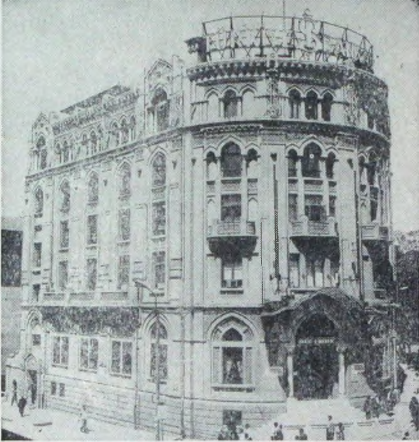
Umum Müdürlük - Ulus Meydanı (Ankara)