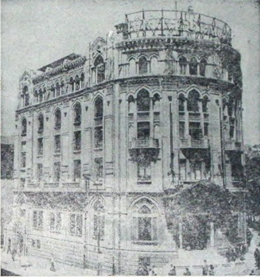
Umum Müdürlük - Ulus Meydanı (Ankara)