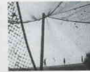
Pojken och Draken (1962) YÖN: BO WIDERBERG