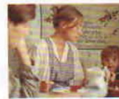
Adalen 31 (1969) YÖN: BO WIDERBERG