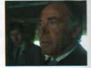
Mannen på Taket (1976) YÖN: BO WIDERBERG