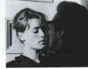
Aşk 65 (Kärlek 65, 1965) YÖN: BO WIDERBERG