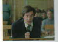
Joe Hill (1971) YÖN: BO WIDERBERG