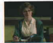
Lust och Fägring Stor (All Things Fair, 1995) YÖN: BO WIDERBERG