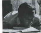
Kuzgun Çıkmazı (Kvarteret Korpen, 1963) YÖN: BO WIDERBERG