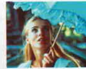
Elvira Madigan (1967) YÖN: BO WIDERBERG