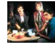
Bir Avuç Cennet (1985) YÖN: MUAMMER ÖZER