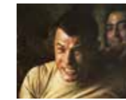
Geceyarısı Ekspresi (Midnight Express, 1978) YÖN: ALAN PARKER