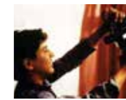
Hollywood Kaçakları (1996) YÖN: MUAMMER ÖZER