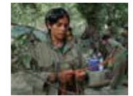
Bakur (2015) YÖN: ÇAYAN DEMİREL, ERTUĞRUL MAVİOĞLU