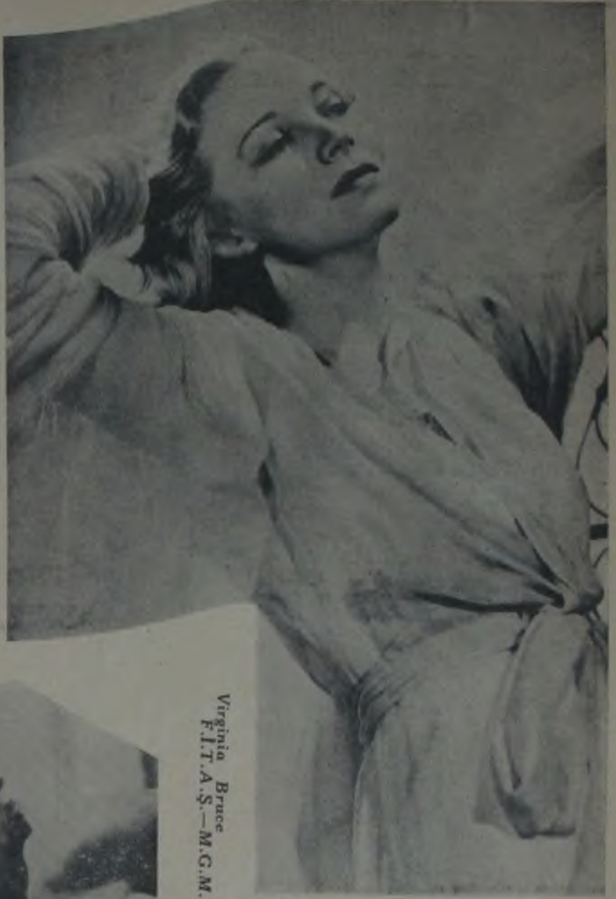
Virginia Bruce

Janet Gaynor bu filmde gene büyük bir muvaffakiyet göstermiştir.