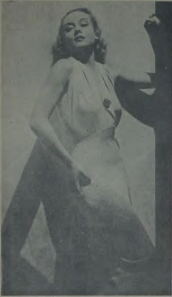
Hollywood'da doğrudan doğruya teni üzerine esbaplarını giyen yegâne yıldız Carole Lombard