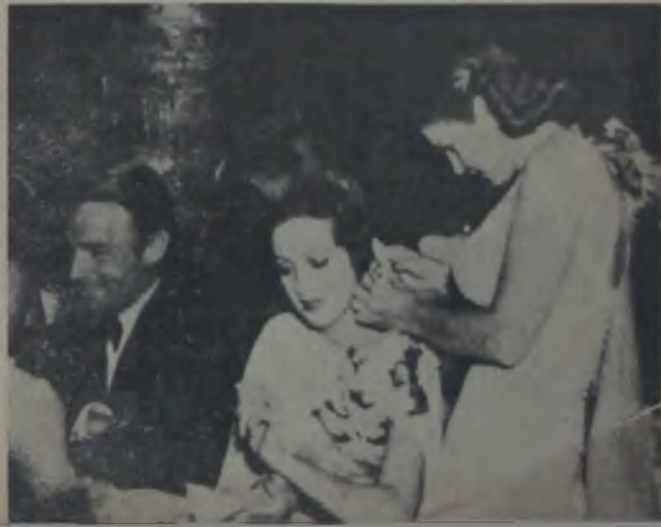
Randolf Scot, Dorothy Lamour ve Martha Ray, Cocaunut Grove kabaresinde