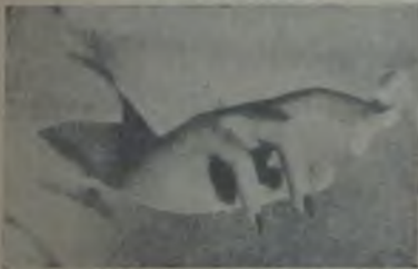
Sigara... insanın neşesi ve dert ortağı

Güzel buklemi Mary Pichford, sporcu tavırlı Bebe Daniels ve Pearl White modaları artık geçmiştir.