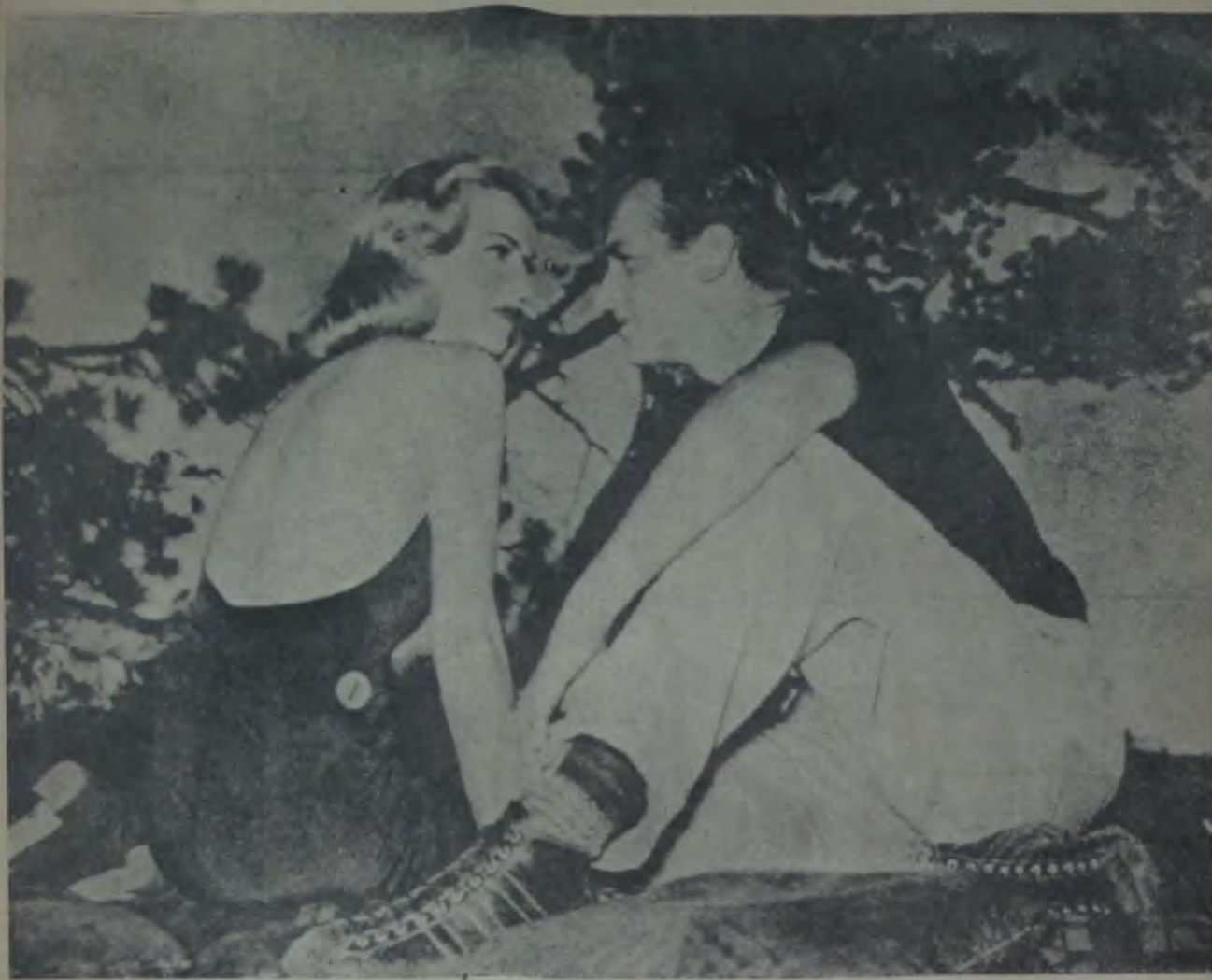
Ginger Rogers ve Doug Junior «Epey eğlenmiştik» isimli filmlerinde