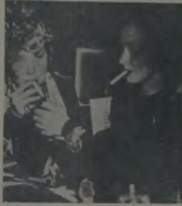
Marlen de sigara yakmasını biliyor işte Mistinguet'in sigarasını yakıyor