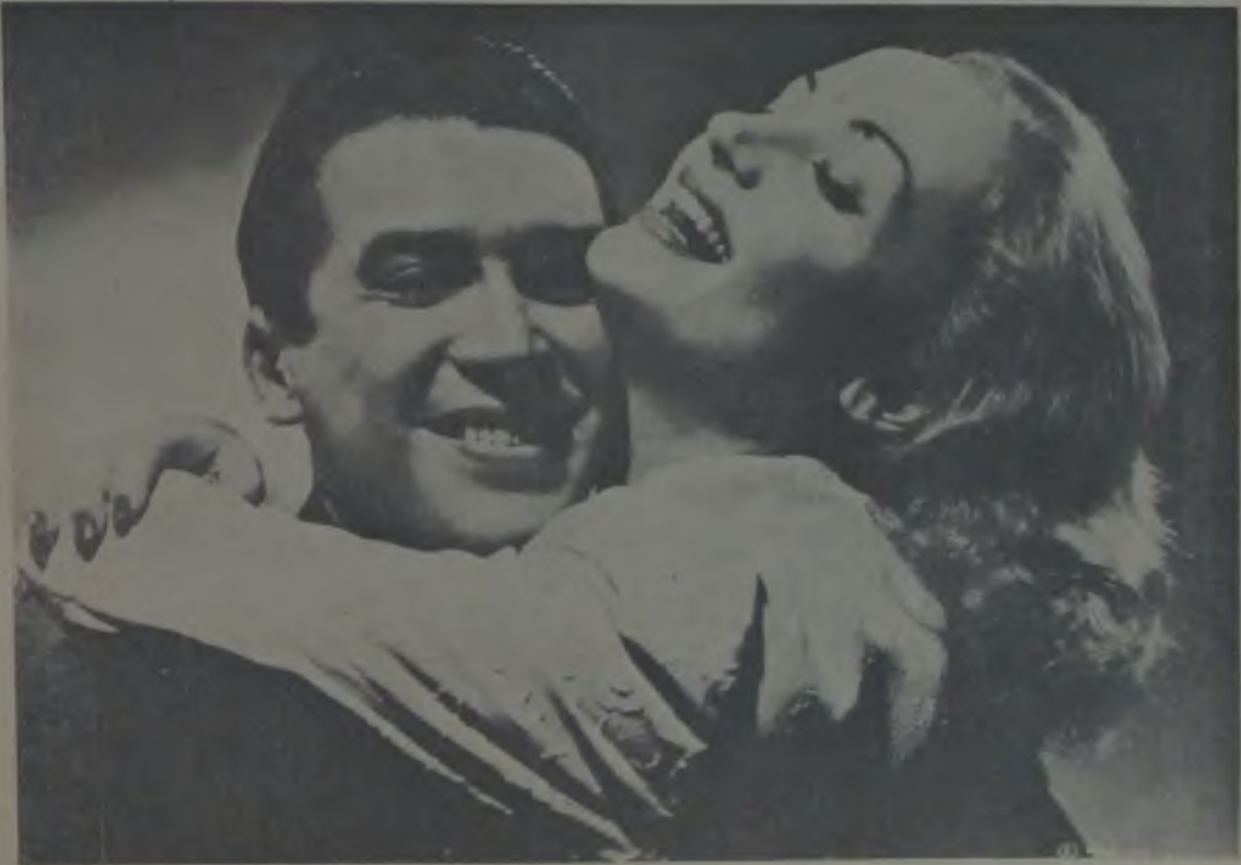
F.I.T.A.Ş.—United Artists Carole Lombart ve Jannes Stewari «Birbirleri için yaratılmış» isimli filmin bir sahnesinde

İstanbul'a yeni bir sinema salonu kazandıran Bayan ve Bay, Cemil'e bilvesiyle sinemaya ismini yeren "LÂLE FİLMER," firmasına muvaffakiyetler dileriz.