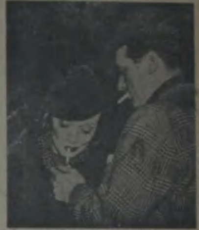
Waterloo istasyonunda Marlen Dong junior'dan ateş istiyor

Bu sırada Gracie Field'in filminde kendisine küçük bir rol verildi, Filmdeki bütün rolü bir sahnesinde iki