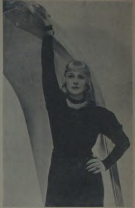
Clark Gable'le «Idiot's Delight» filminde görünen Norma Shearer

Bu muvaffakiyetinden sonra kendisine bir çok büyük filmlerde baş roller verileceği ümit ediliyor.