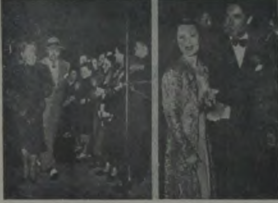
Tyrone Power'in aşk hayatı: Norma Shearer,

cici bir amerikalı olan Arleene Wheelan'la flörte başlıyor.