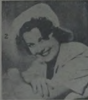
... Olympe ...

Filvaki Errol Flynn, yakında "Beyaz Raca," isimli bir film çevirecektir. Bu filmde baş rolü bizzat deruhte ettiği gibi, senaryosunu da kendisi yazmıştır. Film Amerika'da şimdiden büyük bir alâka ile beklenmektedir.