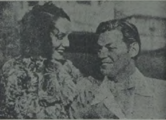
Kavga, dövüş ailesi Lupe Velez ve John Wesmüller