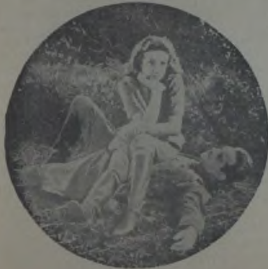
Deanna ve Melvyn Douglas

Daha on altı yaşına basmadan meşhur olmuştu; ve bu muvaffakiyete daha o zamanlar sinema için elverişli telâkki edilmeyen bir yaşta sahip olmuştu.