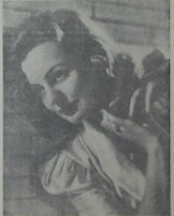
... Andrea Leeds United Artists—F.I.T.A.Ş.

Filmde baş rolü yani Mr. Moto rolünü Peter Lore yapmaktadır.