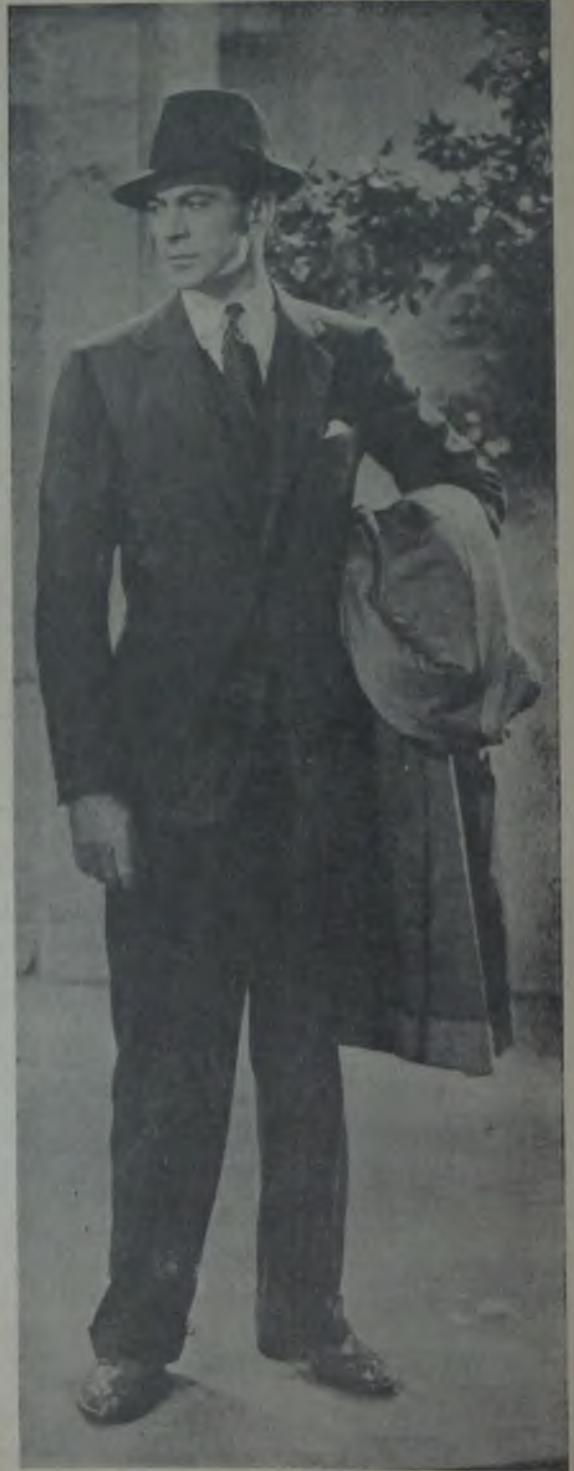
Hollywood'un en rağbet gören erkeği Garry Cooper