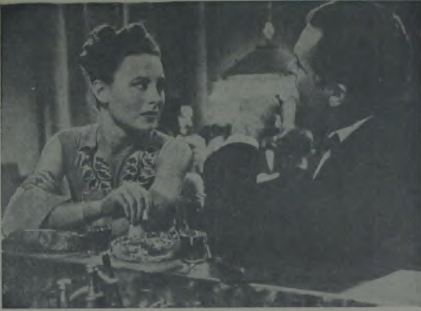
Michelle Morgan «Cazip Kadın» (Entraineuse) filminde