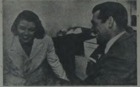
Myrna Loy ve Clark Gable boş vakitlerini dama oynuyarak geçiriyorlar