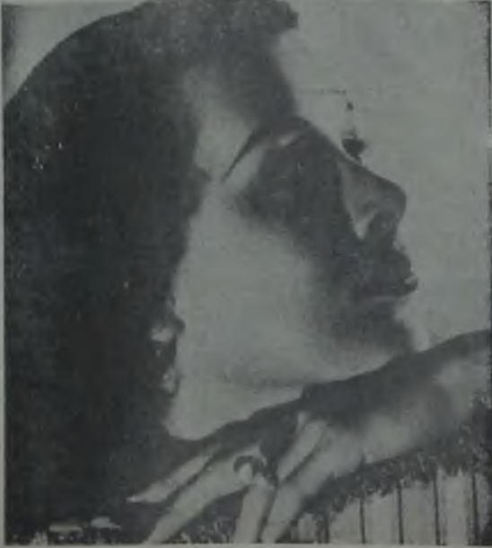
Hedy Lamarr

Onun için şayet onunla karşılaşmak saadetine kavuşurşanız sakın fotoğrafını almağa kalkışmayınız.