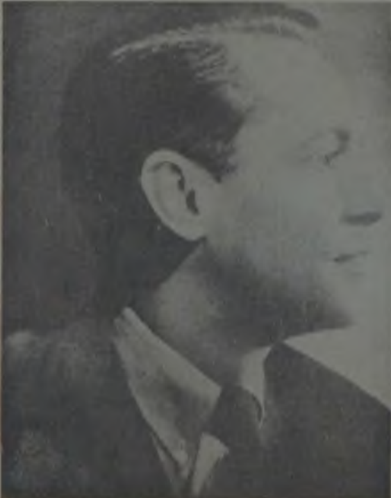
Franchot Tone

Hakikatte bu adamın simasında şark tipinden eser yoktu fakat Samuray ırkını burada misal almama sebep olan bir uzak şarklı kadar derin ve hain bakışlara sahip oluşturdur.