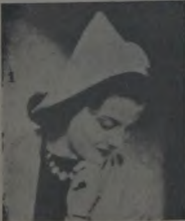
Yeni yıldız ...

1919 senesinde kurulan ve bu günlerde 20 inci senesini kutlulayacak olan United Artists kumpanya-