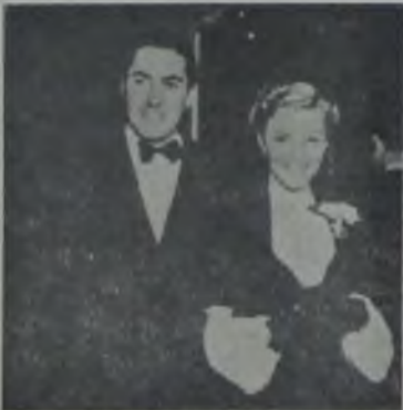
Tyrone Power ve Annabella (H.M.) ve Annie Ducaux.

sizlere bildiriyoruz «Büyük avantür, Salon avantür, Salon, Avantür ve Kavboy,