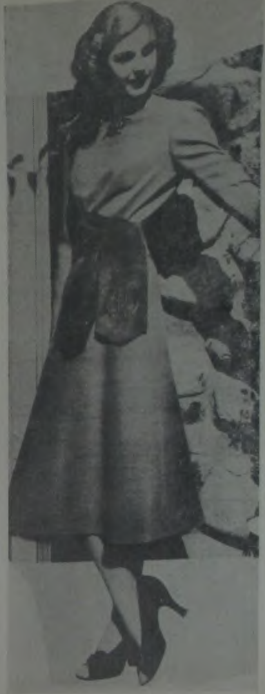
Anita Louise'in son model bir robu