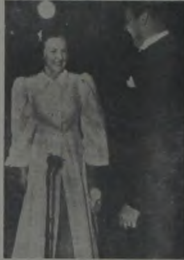
Deanna Durbin

"Jesse James," isimli eserde gösterdiği büyük muvaffakiyetten sonra kendisine "Suzannah," ve "Abraham Lincol'nun hayatı," isimli filmlerde