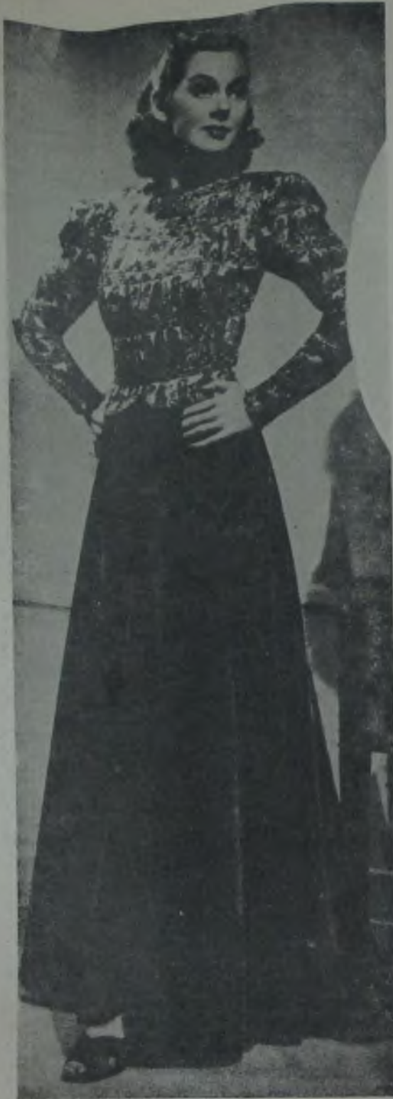
Kale filminin yıldızı Rosalinde Russel'in bir tuvaleti

Bu mevki onu alâkadar ediyor, burada bir çok hizmetlerde bulunabileceğini ümit ediyordu, fakat Chris-