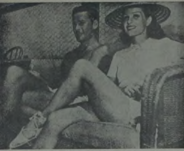
Nihayet ayrılan Errol Flynn ve Lily Damita