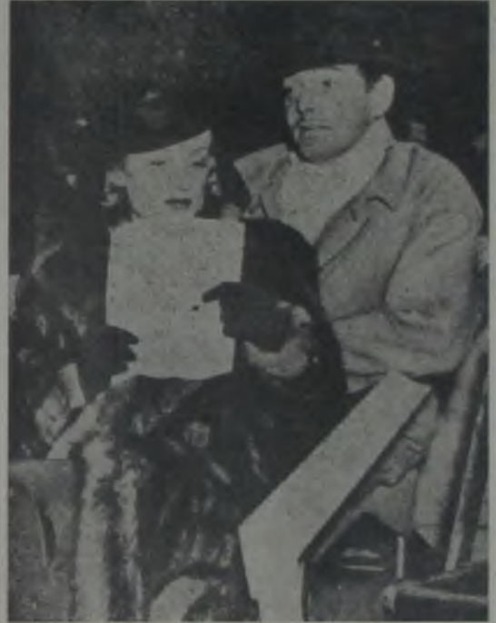
Nihayet evlenen Carole Lombard ve Clark Gable'