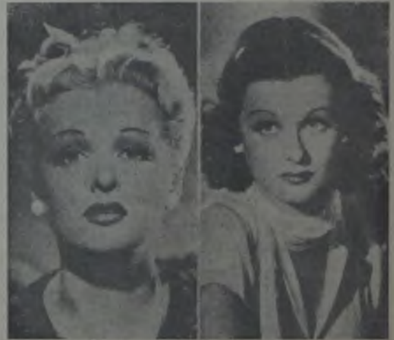
«Sarı Sigaralı Kadın» filmin kahramanı Joan Bennet