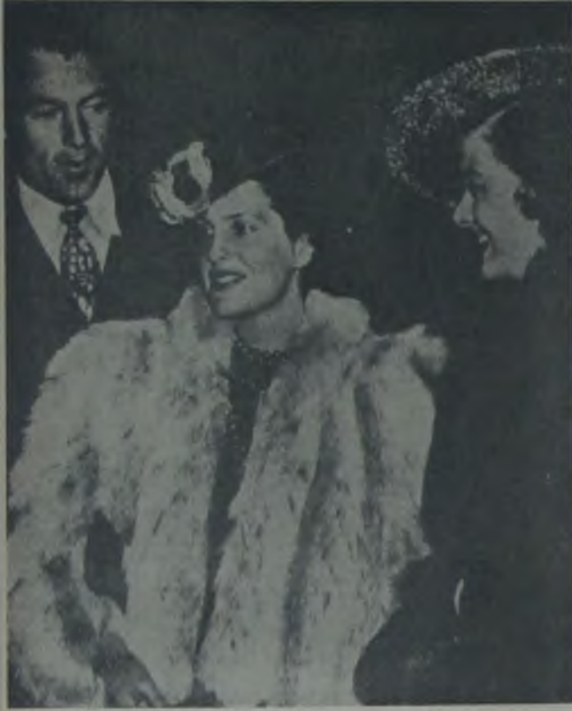
Garry Cooper, karısı ve Myrna Loy'la birlikte

Bu uslu tabiri belki de prensip ittihaz etmiş bir adamdır.