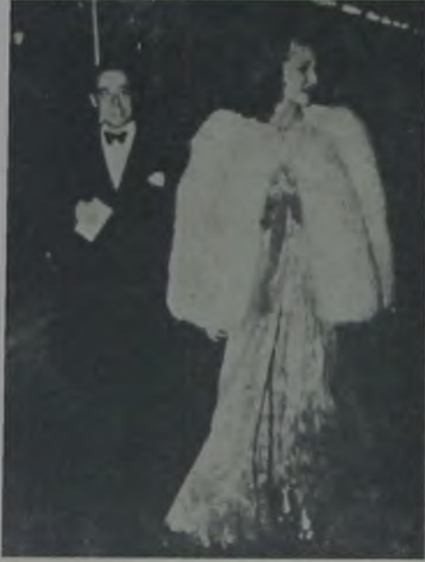
Anita Louise

Şehrimizdeki "Lâle filmler," firmasının İstanbul'a aynı ismi taşıyan, yeni büyük bir sinema kazandırdığını geçen nüshamızda bildirmiştik.