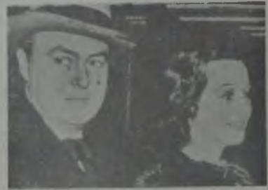
Bir vakitler Simone Simon'la evlenmek isteyen Geue Markey karısı Hedy Lama'la

Richard Green, Sonya Hennie'yi terk edip Loretta Young'la flörte başlıyor, biraz sonra onu da terk edip