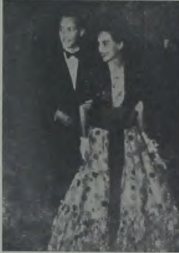
Joan ve Franchot Tone

Düşes Petrovna—Charles Boyer ve Carole Lombard tarafından.