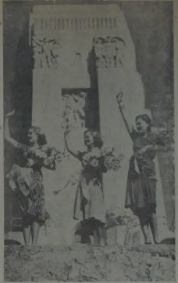
Üç güzel sizleri selamlıyor...

Şarımtrak tenine rağmen bu adam Avrupada doğmuş olabilirdi. Bu garip adamı tetkikten kendimi alamıyordum.