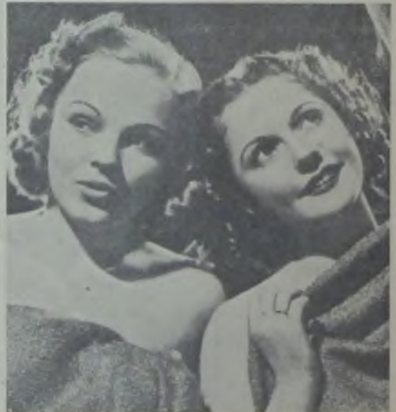
... ve İkiizler

Dük ve düşes film’in sonunda, eseri çok beğendiklerini söylemişlerdir.