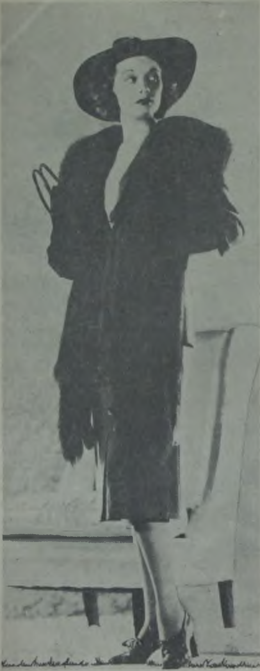
«The Joy of Living» filminin yıldızı Lucille Ball'in bir tagörü Lâle filmler