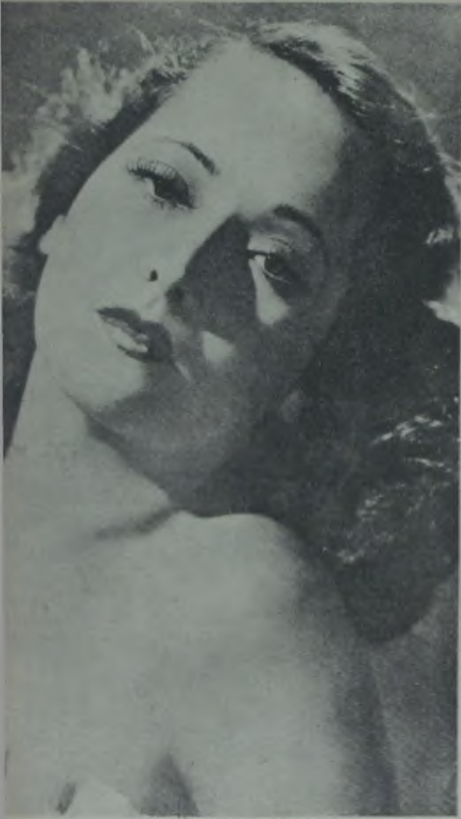
Merle Oberon U. A.—F.İ.T.A.Ş.