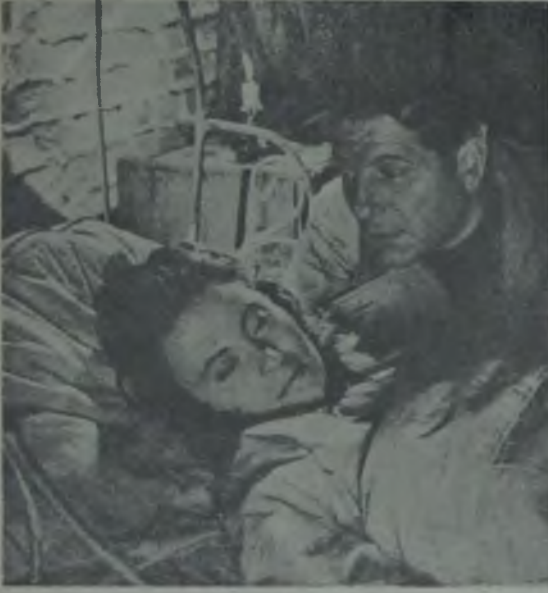
Michèle Morgan ve Jean Gabin «Mercanlık Kayası» filminde