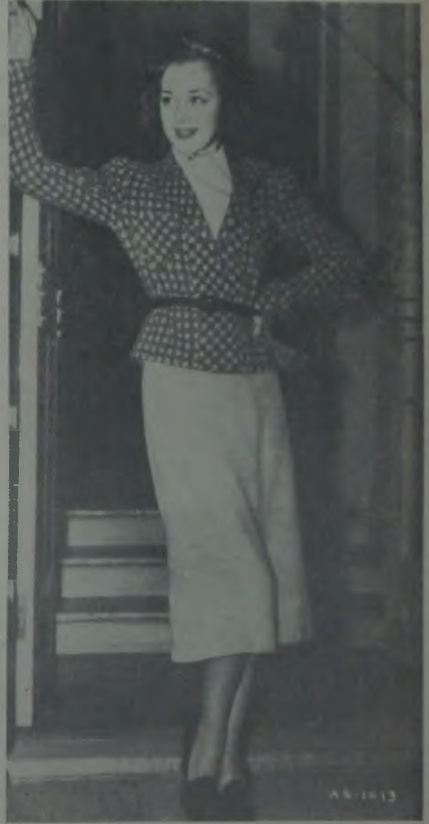
Hollywood'un en güzel yıldızlarından Anne Shirley Lâle filmler

Sinema prodüktörleri o akşam lâlettayin bir salonu kiralayıp, piyasaya çıkarmadan evvel, nasıl bir tesir