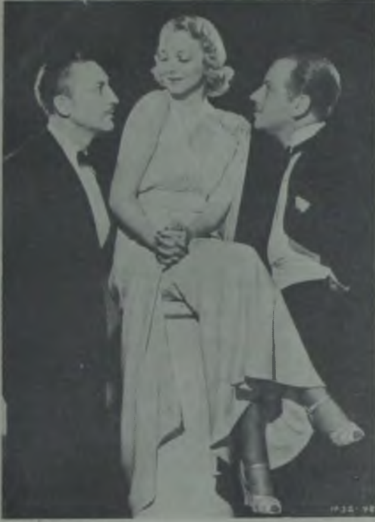
«Arsen Lupen» yıldızları Melwyn Douglas, Virginia Bruce