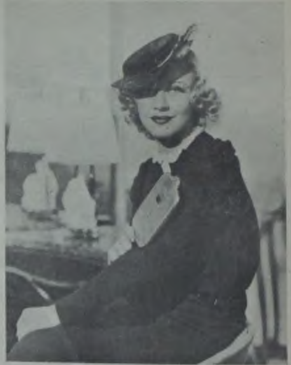
Sizlere yeni bir şapka modelini taktim eden, ve halihazırda Fred Astere'le «Nevet Gorna Dance» filmini çeviren Ginger Roger (Lâle filmler)