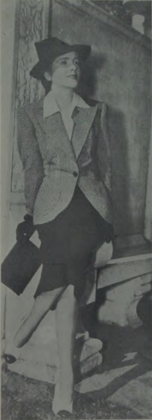
Mavi renkte jaketli bir tayyör Joan fontaine Lâle filmler

Daimi güneşli hava, yakında bulunan Los Angeles şehrinin yol sahnelerini çevirmeğe elverişli olması, bütün masrafları New-York'a nisbetce fazlasıyla azaltıyordu.