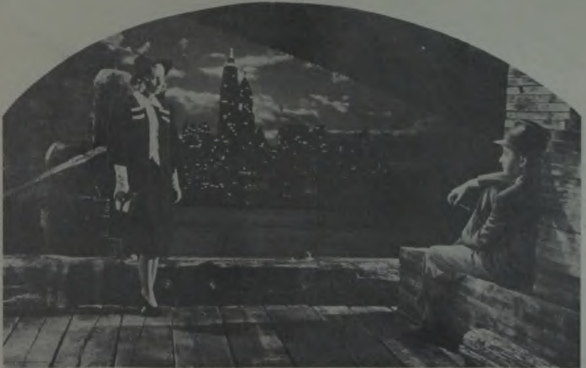
Barbara Stanwyck ve Herbert Marshall «Elveda» filminde

Münderecatımızın çokluğundan dolayı bu hafta "Hıtrırat" isimli tefrikamızı dercedemiyoruz. Özür dileriz.