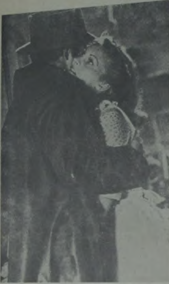
Nancy Kelly ve T. Power «Sevgili haydut» filminde