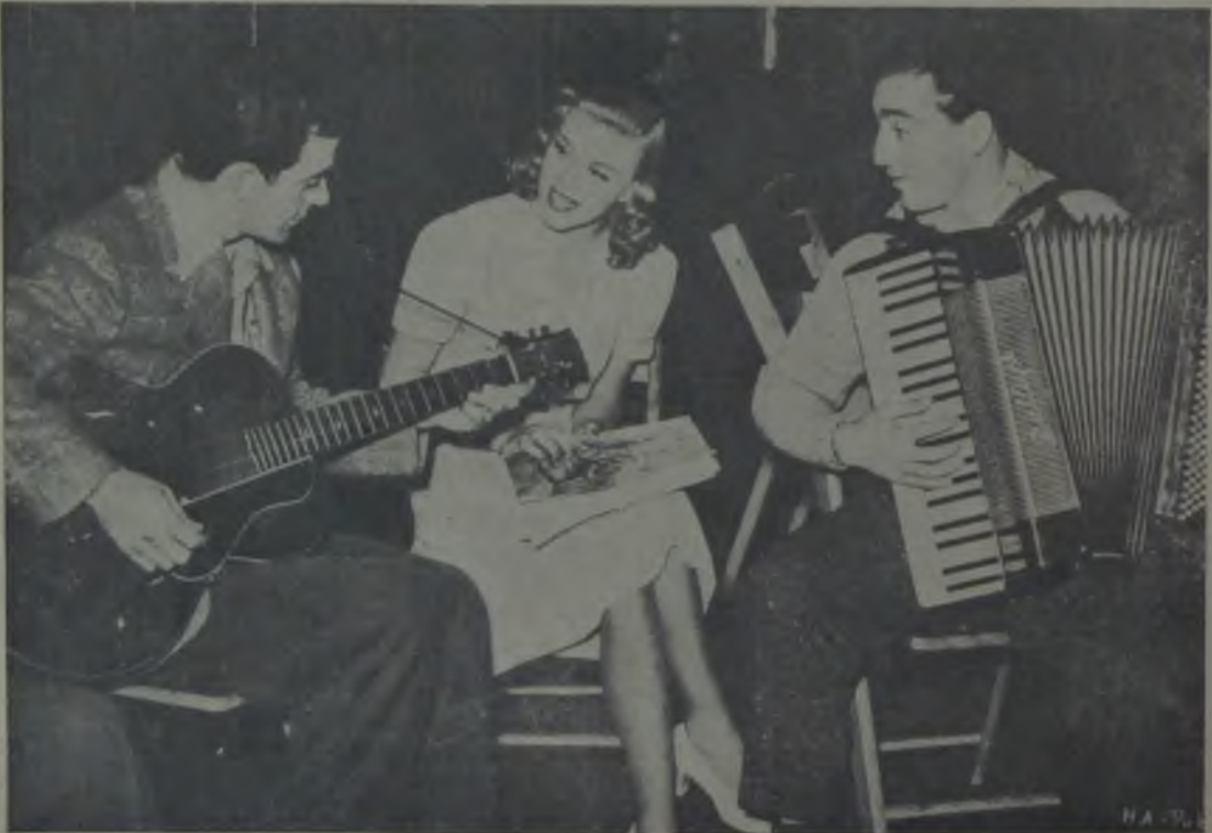
Ginger Rogers son fiimde