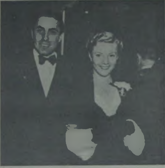
Annabella ve Tyrone Power