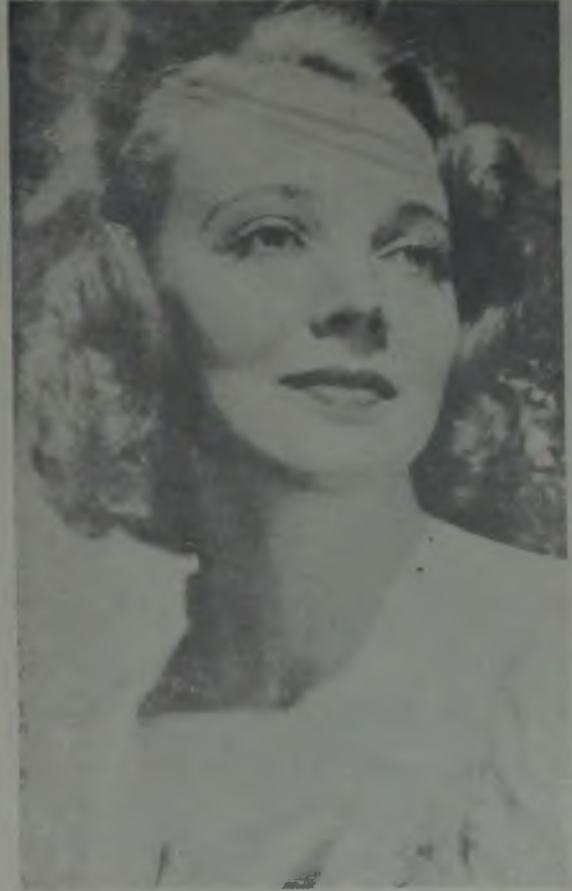
Virginia Bruce

Amerika'da 1931'den beri sinema hayatına atılmış