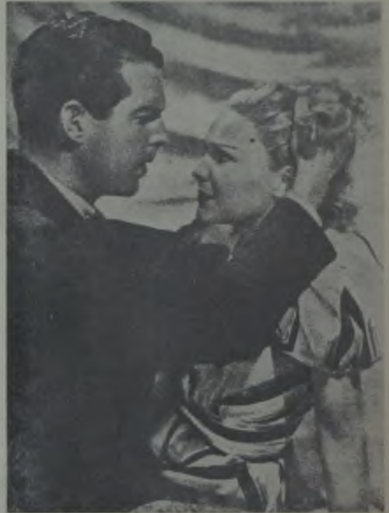
Fred Mc Murray ve Madeline Carole «Gale Switente»

Bu acaip yerde, bu siyahlı kadınla karşılaşmanın bilâhare hayatının cereyanını değiştirmeye varacağını o zaman nasıl olurda aklımdan geçirebilirdim?