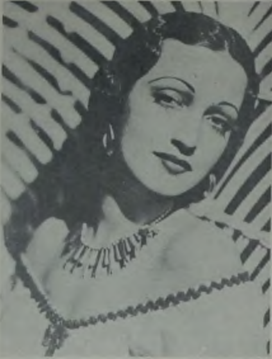
Dorothy Lamour U.A.—Fitaş