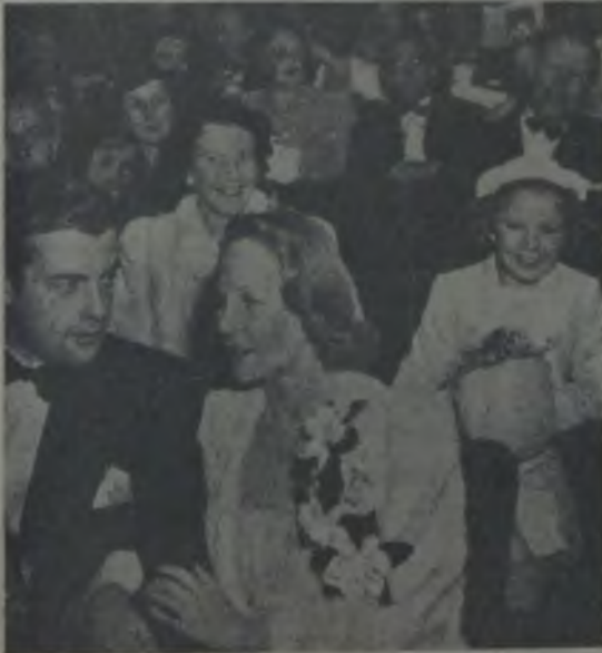
Richard Green ve Wendy Barrie (H.M.)