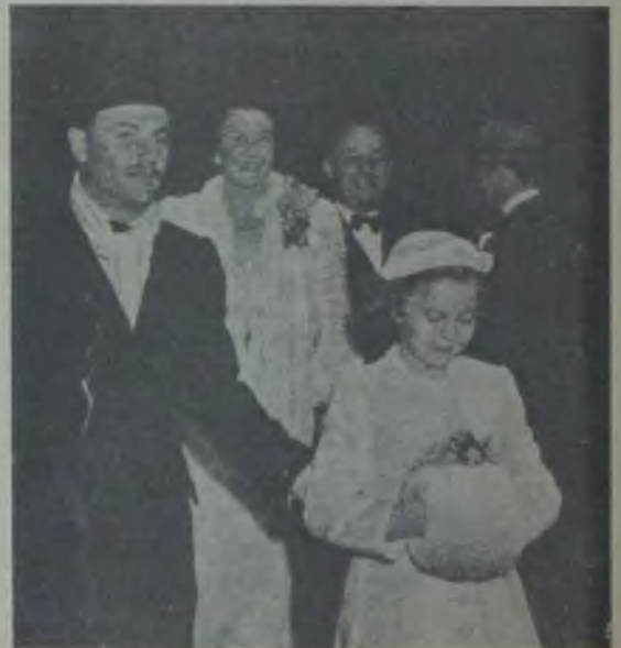
Shirley Temple ve Ailesi (H. M.)