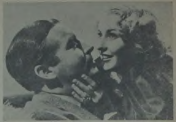
John Boles ve Barbara Stanwyck

Nihayet 23 Ağustos 1926 da birdenbire ölüverince dünya yerinden oynadı, bütün kadınlar onun arkasın-