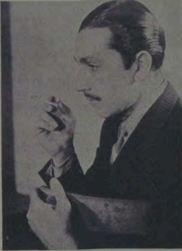
Ferdi Tayfur «Güneşe Doğru» filminde

Fakat maalesef, bu filmlerin adedi sekiz on taneyi aşmadığı gibi üç dört senedir de memleketimizde bir tane bile büyük mevzulu türkçe film göremedik.