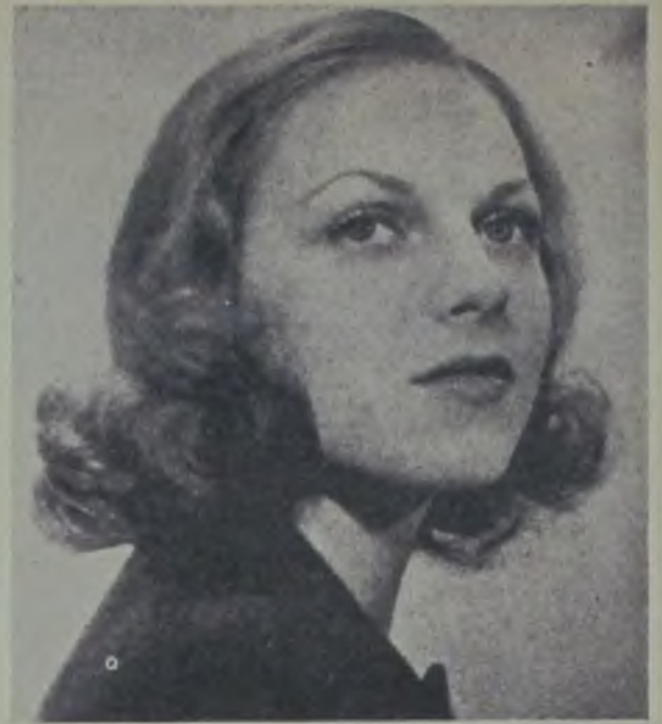
İstikbalin yıldızı: Gloria Dickson ve...