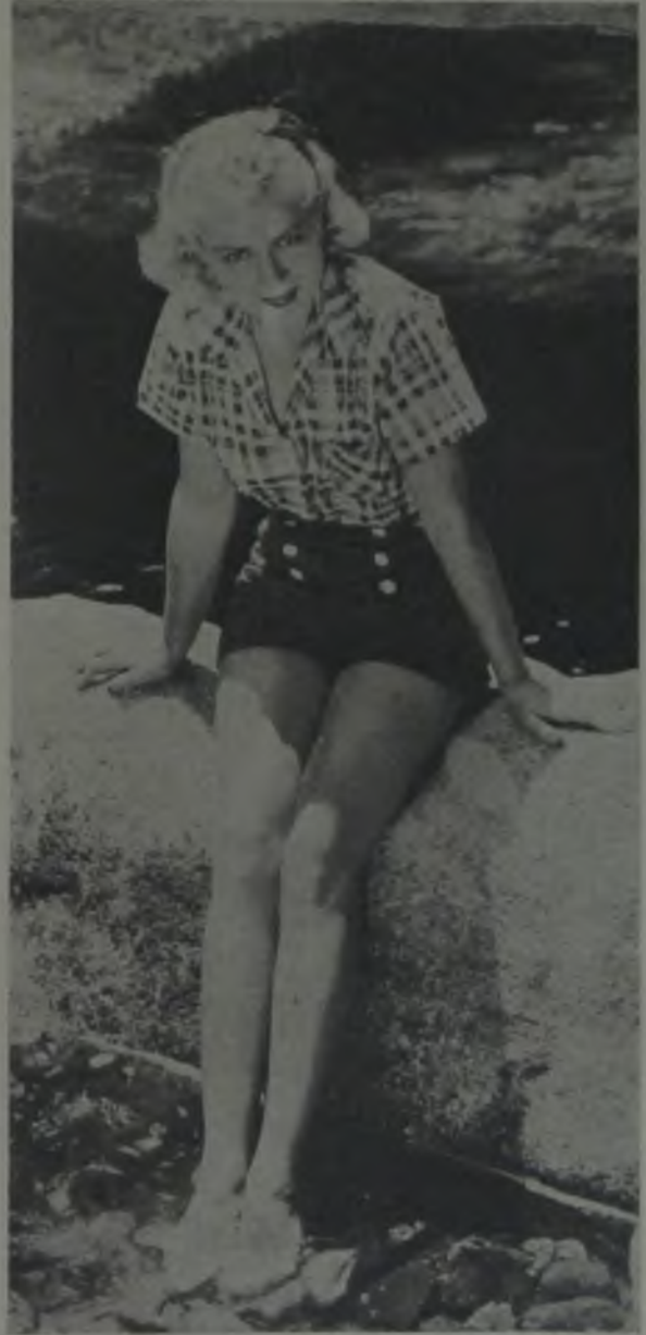
Claire Trevor Fox