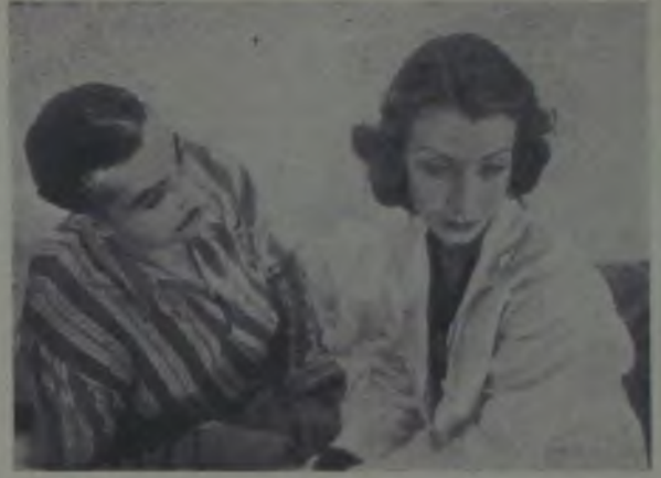
«Güneşe Doğru» filminden bir sahne

Buna rağmen, memleketimizde yeni kurulan bir şirket, yeni bir teşebbüse girişerek bir film çevirmiştir.