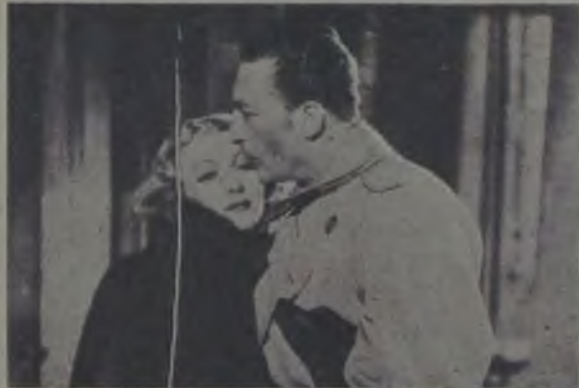
«Kanun Harici» den bir sahne.

Maceralı bir hayat tarzının çerçevelediği aşk filmle- rini görmekten hoşlananlar için bu film tam yerindedir zannedirim.