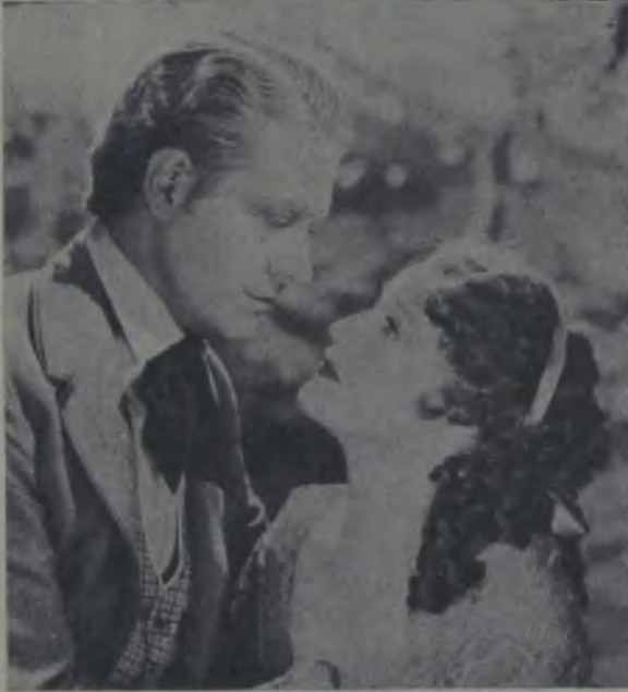
Yakında göreceğiniz «Leylâklar Açarken» filminde Jeannette Mc Donald ve Nelson Eddy

Bütün bu kalabalık arasında iki kişiyi mecmuamız namına seçerek konuşmak çarelerini araştırdım.