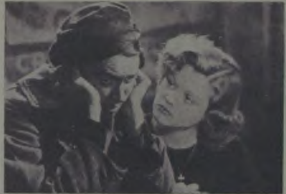
«Beyaz Melek» ten bir sahne.

Bu iki filmi genç yıldızın yanında Jean Hersholt gibi Amerikanın güzide ihtiyar yıldızlarından biri oynamaktadır.