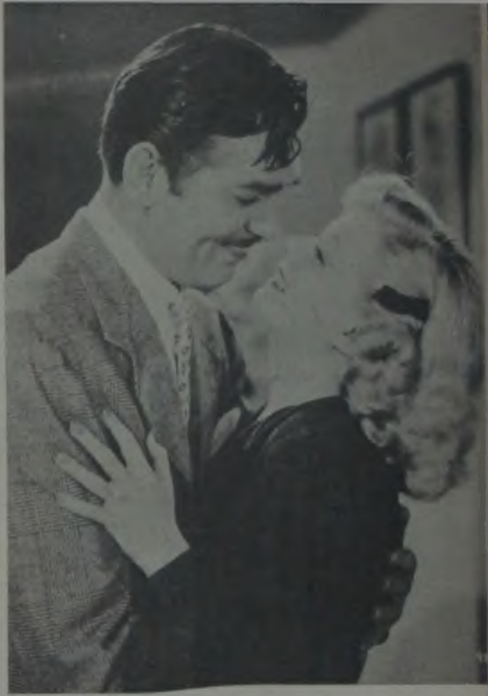
Saratoga'da Clark Gable ve Cin Harlow