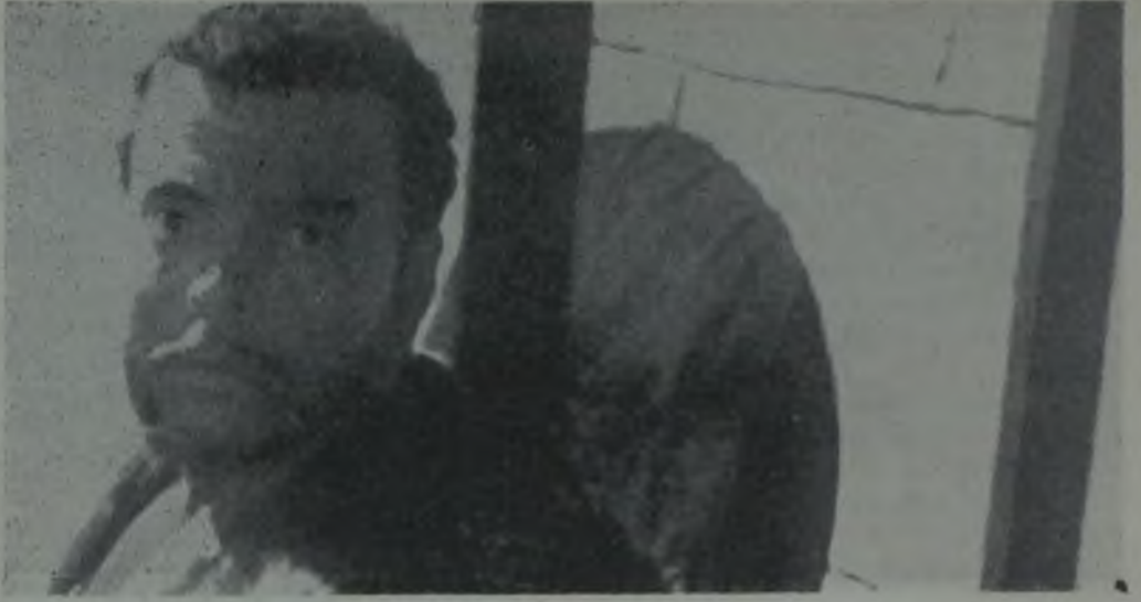
OTELLO / ORSON WELLES / 1952

ren bir dekor kullanmıştı. Otello'da ise yapaylık açık havadadır ve bütünüyle doğal bir nesneden oluşturulmuştur. Kesik ve soluk kesici kurgusu, çekim açıları (dekorun öğelerini boşluğa yerleştirme şanslarını göz ve akıl için bütünüyle yok eden) yoluyla Welles, Venedik ya da Mogador taşlarından hareketle düşsel ve dramatik, ama yine de bütün görkemiyle ve yalnızca yüzyıllar boyunca güneş ve rüzgârın aşındırdığı doğal taşların gerçek mimarisinin taşıyabileceği şaşırtıcı güzellikler ve raslantılardan kurulu bir mimari yaratıyor. Böylece Otello açık havada geçiyor ama doğanın içinde değil. Bu duvarlar, bu kubbeler, bu yankılı geçitler, düşünmüyorlar ve trajikliğin güzel konuşmasını aynalar gibi çoğaltıyorlar. (Welles'in kahramanları olan) Bu ayrıcalık varlıklar genel kurallara göre yargılanmamalıdır. Onlar başkalarından aynı zamanda hem daha zayıf, hem daha güçlüdürler. Daha zayıftır: «Saçmalamaya başladığım zaman sonuna dek gitmeme hiçbir şey engel olamaz» diye itiraf eder Lady from Shanghai'n başındaki denizci Michael O'Hara. Ama ne kadar da güçlüdür onlar, çünkü nesnelere gerçek anlamlarıyla doğrudan doğruya ilişkileri vardır, ya da tanrıyla demeli belki nesnelere yerine. İşte bu karmaşıklığıdır ki sonunda Citizen Kane'den bu yana Welles'in bü-