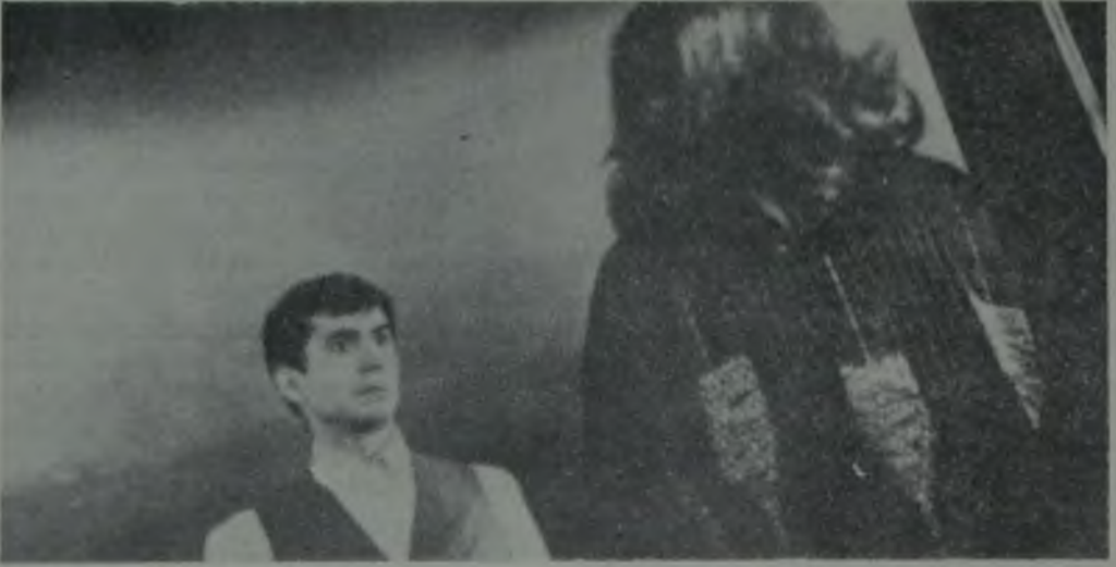
DAVÂ / THE TRIAL / ORSON WELLES / 1962

söz konusudur bu yapıtta. Gerçekten de, Welles, örneğin Dos Passos'un kullandığı o toplu bakış açısını bilinçli olarak yadsıamak ister gibidir. Sartre ne de güzel söylemiştir: «Bir yaşamı Amerikan gazetecilik tekniğiyle anlatmak, onu, Salzburg dalı gibi toplumsal bir gerçek haline getirmeye yeter. ( ) Dos Passos'un insanı, hem içe, hem dışa dönük, melez bir varlıktır. Onunla birlikte, onun içindeyizdir, onun sallantılı bireysel bilincinde yaşarız, ama birden bu bilinç direnmekten vazgeçer, zayıflar, toplumsal bilinç içinde eriyip gider.» Oysa Yurttaş Kane'in amacı, toplumsal bilincin hiç bir zaman bir bireyi özetleyemeyeceğini göstermek, ve son derece bütüncü toplumsal bir yapı tarafından ta özünden bozulmuş da olsa, azıcık değerli bir insanın hemen sürüden ayrıldığını, göze battığını ima etmek değil midir?