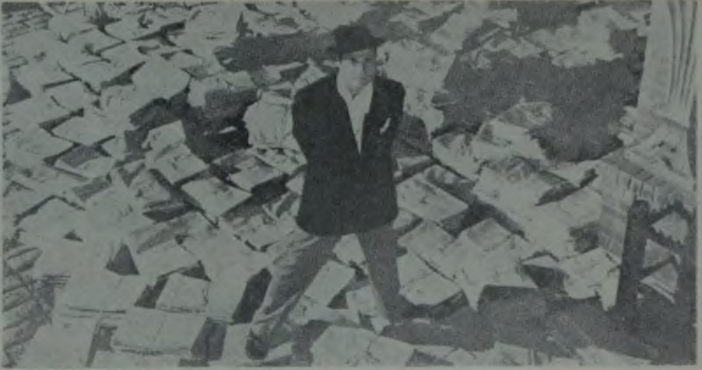
YURTTAŞ KANE / CITIZEN KANE / ORSON WELLES / 1941

lük Sonsuzluğu için de şöyle der: «18.5’u yeğlemem; ille de içimden geldiği gibi çalışmak istemem. (...) Daha önce bakılmamış açılardan bakıyorum. Bu türlü görüntülerden bıkmak kadar çok görmedim henüz. Onun için, bu ışın sapmasına yepyeni bir gözle bakabilirim. Bu, benimle 18,5 arasında büyük bir yakınlık var demek değil, yalnızca, bakışın yeniliğinden gelen bir şey.»