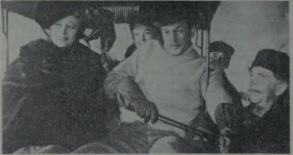
MUHTEŞEM AMBERSONLAR / THE MAGNIFICENT AMBERSONS / ORSON WELLES

liştirdiler. Welles ise onu (üstü kapalı) iç sahneler’de, aralıksız sürüp giden bir ikili konuşmanın temel boyutlarından birini oluşturduğu birtakım sesli bakış açıları örgüsü içinde canlandırmaktadır. 1946 yılında eleştirmenlerin Yurttaş Kane ’i çözümlerken ne büyük zorluğa düştüklerini hatırladıkça insanın gülesi geliyor, gerçekte, o günlerin sinema eleştirisi, bu filmi dinlemeye dayanamayacak durumdaydı genel olarak. Cahiers du Cinéma dergisinin, Welles’i, çağdaş sinemanın ağababası sayması çok yerindedir. Bresson’dan on, Antonioni’dan on beş, Resnais ve «edebî» filminden yirmi yıl önce, Welles, diyalektik olarak, sözlü sinemayı sözsüze dönüştürmeye uğraşıyordu. Yani, ses şeridiyle açıklama, söyleme ve anlatma görevinden kurtulan görüntü, abartılmış ima, yoğunluk ve saydamsızlık gibi araçlarla yine o eski açınlama büyüleme ya da göz kamaştırma gücüne kavuşuyordu. Bardèche’in, doğru’nun hemen yakınından geçerek, bu devrimin anahtar’ını vermiş olması epey hoştur doğrusu: « Bu türlü filmler, bize, konuşmanın elbirliğiyle lanetleneneceği günlerin yaklaştığını göstermektedir »