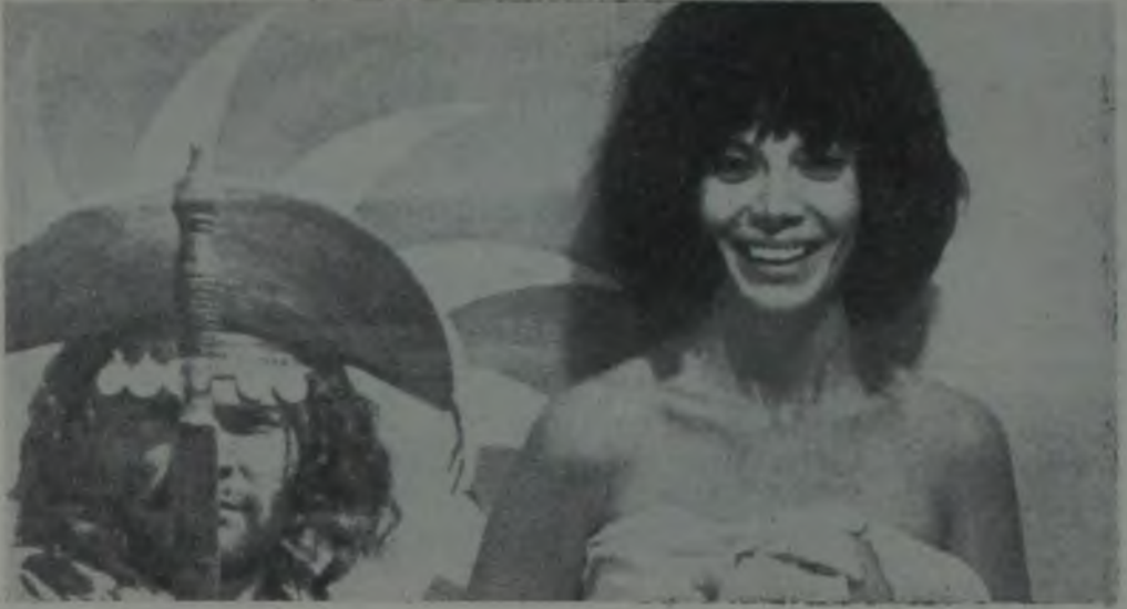
MEYDAN OKUMA / O DESAFIO / PAULO CEZAR SARACENI

ve dağıtımçı pek az bir masraf yapmasına karşın % 10 ile % 15'ini alır. Dağıtımçı parasını hemen çeker ve böylece yapımcının sermayesine el koyar.