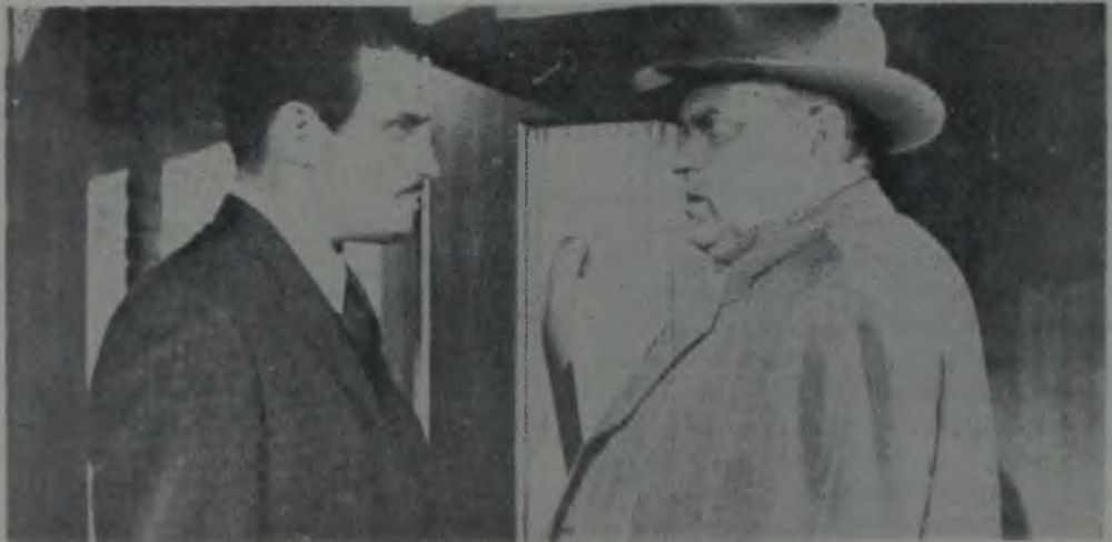
THE TOUCH OF EVIL / ORSON WELLES / 1957

Yurttaş Kane'in sanatını Dos Passos'un kine benzetmek isteyenler de çıktı. Bu karşılaştırma pek de boş değildir. Ancak onu aşmak