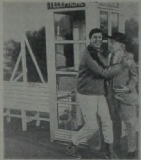
GEVEZE HAFİYE / THE BIG MOUTH

Bir Oscar rekortmeni film de Fred Zinnemann 'ın A Man for All Seasons/Her Devrin Adamı adlı filmi. Bütün sinema uğraşı boyunca belli bir çizginin altına düşmemiş olan, hatta High Noon/Kahraman Şerif , From Here to Eternity/İnsanlar Yaşadıkça , Teresa gibi başyapıtlar veren Zinnemann bu yılın en ilginç filmlerinden birini sunacak bizlere. Un-