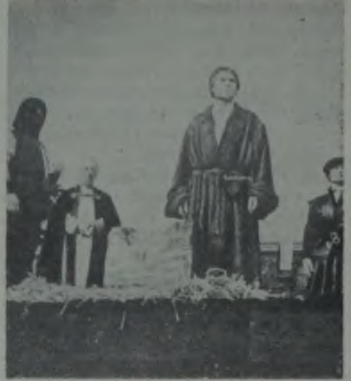
HER DEVRİN ADAMI

Vincente Minnelli yıllar yılı Hollywood'un en önemli kişilerinden biri olarak kendinden sözettirdi. Müzikal türünün bu büyük ustası «Ziegfield» döneminin çöküşünden sonra ne yaptığını bilmez şekilde The 4 Horsemen of the Apocalypse , The Sandpiper vb. verdi. Bu yıl gösterilecek The Courtship of Eddie's Father/Annem kim olacak , bu sonuncular-dan biraz değişik. Yine de Minnelli'yi geçmi-