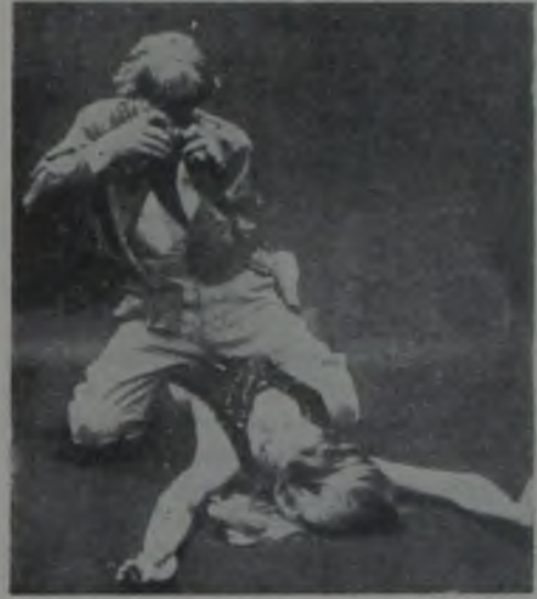
CINAYETİ GÖRDÜM / BLOW UP