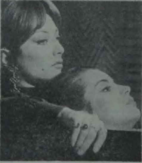
KADIN DOSTLAR / LES BICHES

endüstrileşmiş toplumları arasında en gelişmiş olan Amerikan uygarlığını, «American Way of Life» en doğrudan en sert biçimde eleştiren, yerden yere vuran tek Amerikalı yönetmendir Jerry Lewis. Gün gelecek çok büyük ustalarla, Chaplin'le, Keaton'la karşılaştırılacak, belki de onlardan üstün görülecektir. Lewis'in bu yılki üç filminden birincisi Way Way Out/J. L. Fezayı Kurtaran Adam . (Yön / Gordon Douglas)