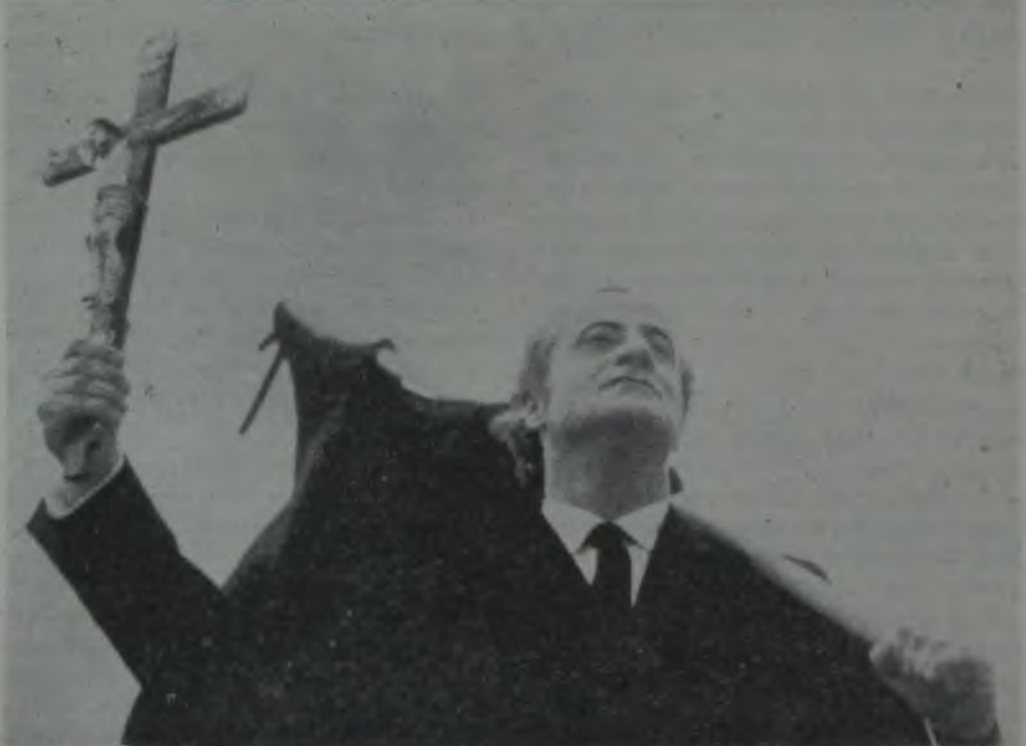
COŞAN TOPRAK / TERRA EM TRANSE / GLAUBER ROCHA / 1967

Gerçeğin araştırılmasının karşılığını, halkın anlayışsızlığıyla ödüyoruz. Ama yanlışlıklar yapa yapa yöntemimizi durmadan düzeltmemiz ve bildiklerimizden yola çıkarak gerçe-