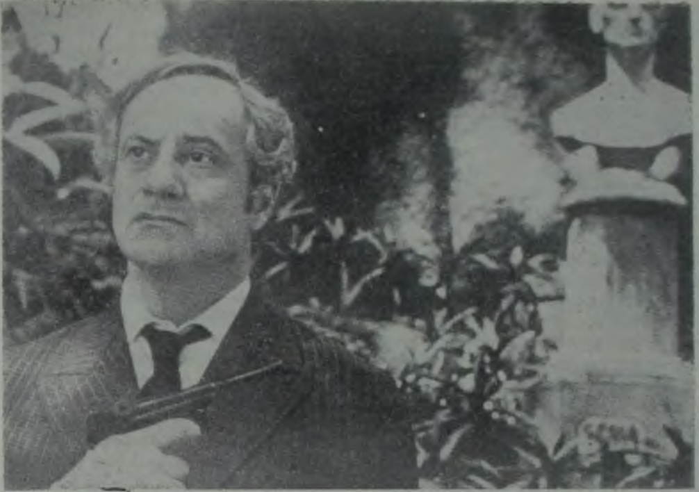
ÇOŞAN TOPRAK / TERRA EM TRANSE / GLAUBER ROCHA / 1967

tün yanlarını tartışmayı zorunlu kıldığını bilmektedir. Gerçekçiliğini belirtmek için köhnemiş Avrupa gerçekçiliğini kullanmamak gerektiğini bilmektedir.