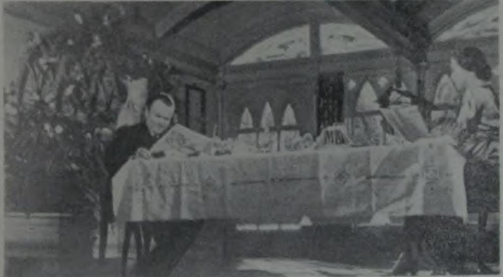
YURTTAŞ KANE / CITIZEN KANE / ORSON WELLES / 1941

Otello'nun sinemaya aktarılışı ve Macbeth 'le bütünüyle zıt yönde oluşu tiyatrodan sinemaya geçiş yönünden çok ilginçtir. Bir tiyatro yapıtını sinemaya aktarırken aşılması gereken en büyük güçlük dekordur. Tiyatro dekorunun somutlaştırdığı dil ve uzlaşmalar sinemanın gerçekçiliğini uymaktadır. Orson Welles Macbeth filmi için yapay ve insanda terkedilmiş duygusu ve