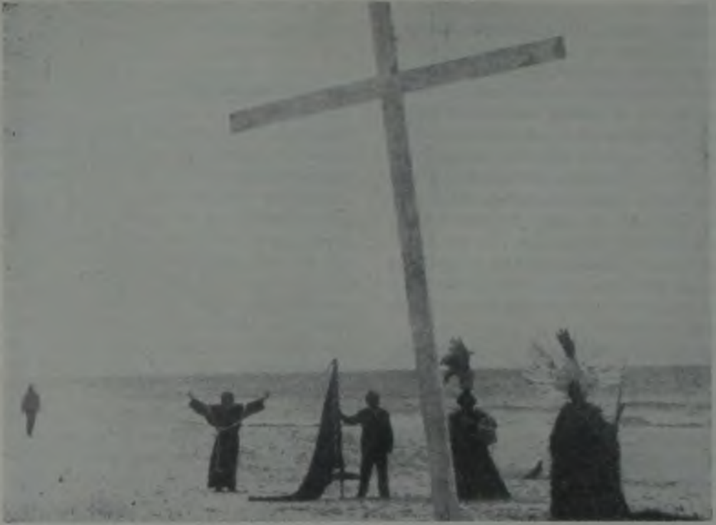
ÇOŞAN TOPRAK / TERRA EM TRANSE / GLAUBER ROCHA / 1967

köye asayişî düzeltmek için çağrılmışlardır: Yiyecek satan bir dükkânı yağma için harekete geçecek ilk «flagellado» (kuraklığın kurbanı) ya ateş edeceklerdir. Askerler de insandır ama kendi dünyalarında yaşıyorlar onlar. Askerler için «flagellado» aşağı tabakadan bir insandır, nedendir bilinmez bir türlü içinde bulunduğu durumdan kendini kurtaramamıştır, tembellikten olacak. Askerse devrimini çoktan yapmıştı.