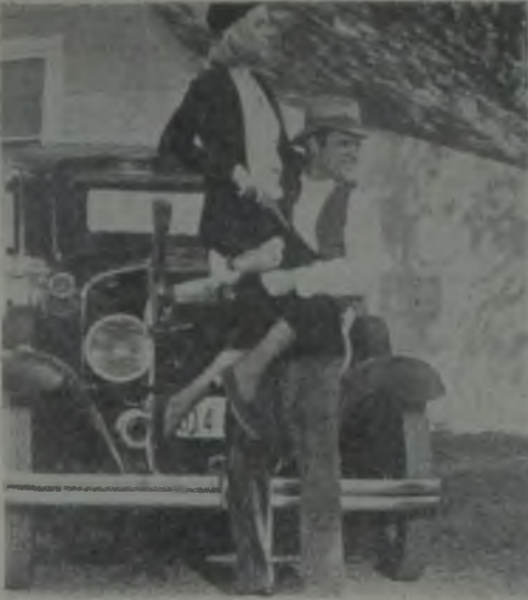
BÖNNIE AND CLYDE

çıkışlarını gördüğümüz Arthur Penn ( The Miracle Worker , The Hustler ) bu filmle ya «kayıp» olacak ya da iyiden iyiye kabul ettirecek kendisini. 1930'larda Amerikayı kasıp kavuran gangsterlik dalgasının bir bölümünü ele alan filmde, Bonnie Parker ve âşığı Clyde Barrow'un serüvenleri bakalım barut, seks, şiddet ve daha başka «saygıdeğer duyguların» dışında ne getirecek «seyircimiz»? Hiç kuşku yok ki Penn'in gösterilecek öbür filmi The Chase/Kaçaklar çok daha ilginç.