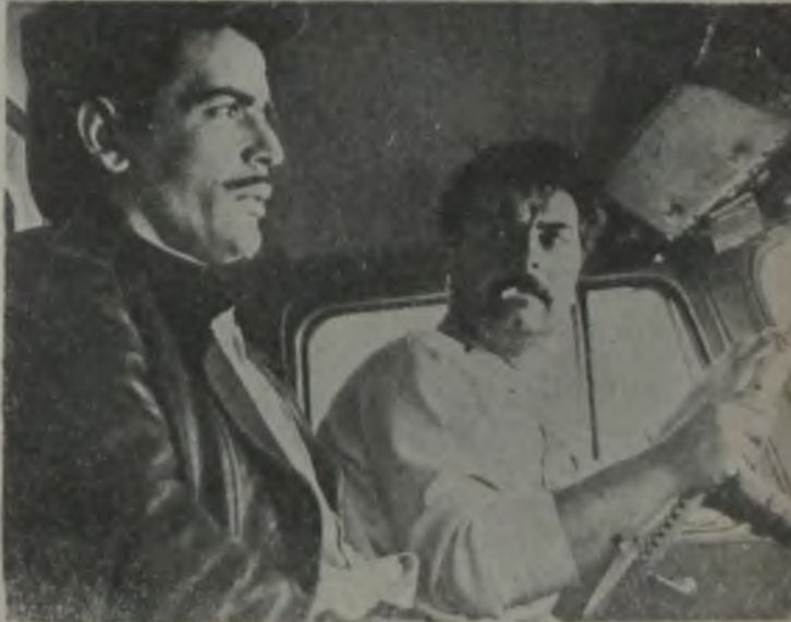
Fehminin hayatta tek amacı, kızkardeşini Tahsin'le evlendirmek ve ona mesut bir yaşayış sağlamaktı...