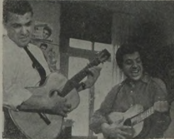
Sezai ve Yüksel çalgınlar gibi tepimlenirken, her iki sünceleri Amerika'ya kaçıp orada şarkıcı Elvis'in havatını vasamaktı...

Pavyonda Avhan'ın sevdiği kız «Julia» şarkısını söylemektedir. Bu durum genci etkârlendirir... Az sonra araba vapurundadırlar. Bir hususi otomobildeki manzara, altı ahbab çavuşun (Devamı 34. sayfede)