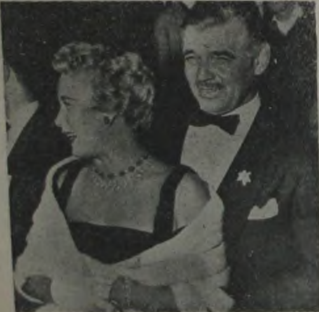
Clark Gable, beşinci karısı Kay Speckles ile beraber.

Memleketimizde, «Rüzgâr Gibi Geçti», «Macera», «Hileli Zar», «Ecel Yarışı», «Yalnız Yıldız», «Casus Aşk», «Maceralar Beldesi», «Dev Adam», «Kral ve Dört Kraliçe» adlı filmleriyle çok sevilen aktör, kendisine film rejisörlüğü yapıp yapmayacağı sorulduğu zaman, «Rejisörlük mü? Ben daha doğru dürüst rol yapmasın öğrenemedim,» derdi.