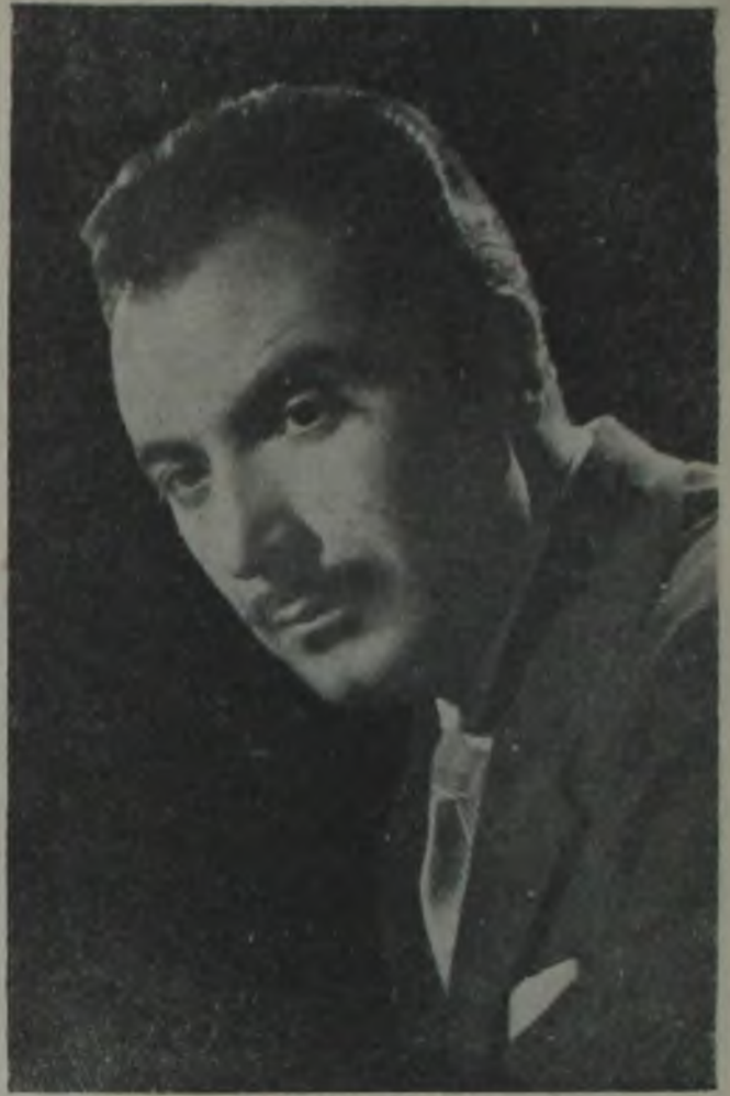
1958'de çevirdiği «Üç Arkadaş» Memduh Ün'ü sinemamızın en başarılı rejisörleri arasına soktu

Bu yıl oldukça yüklü bir çalışma programıyla bütün gücünü ortaya koyan sanatçı, «Mahallenin Sevgilisi», «Kırık Çanaklar», «Ölüm Peşimizde» adlı filmlerinde rejisör, «Ölüm Perdesi», «Namus Uğruna», «Aşk Hırsız» ve «Ölüm Peşimizde» filmlerinde de oyuncu olarak çalışmaktadır.