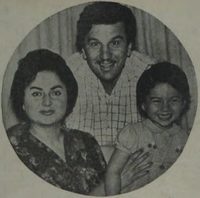
Beyaz perdemizin kötü adamı Ahmet Tarık Tekçe, eşi için çok iyi bir koca, kızı için de iyi bir babadır.

«— Tekçe dedim... Kötü roller oynamaktan memnun musun?..»