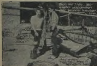
Yeni bir... Singer-Avcuları... Günümüzün... Yeni... Tutulmuş... Singer-Avcuları... Yeni... Yeni...