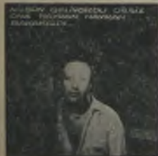
Yeni bir... Singer-Avcuları... Günümüzün... Yeni... Tutulmuş... Singer-Avcuları... Yeni... Yeni...