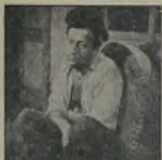
Yeni bir... Singer-Avcuları... Günümüzün... Yeni... Tutulmuş... Singer-Avcuları... Yeni... Yeni...