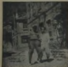
Yeni bir... Singer-Avcuları... Günümüzün... Yeni... Tutulmuş... Singer-Avcuları... Yeni... Yeni...