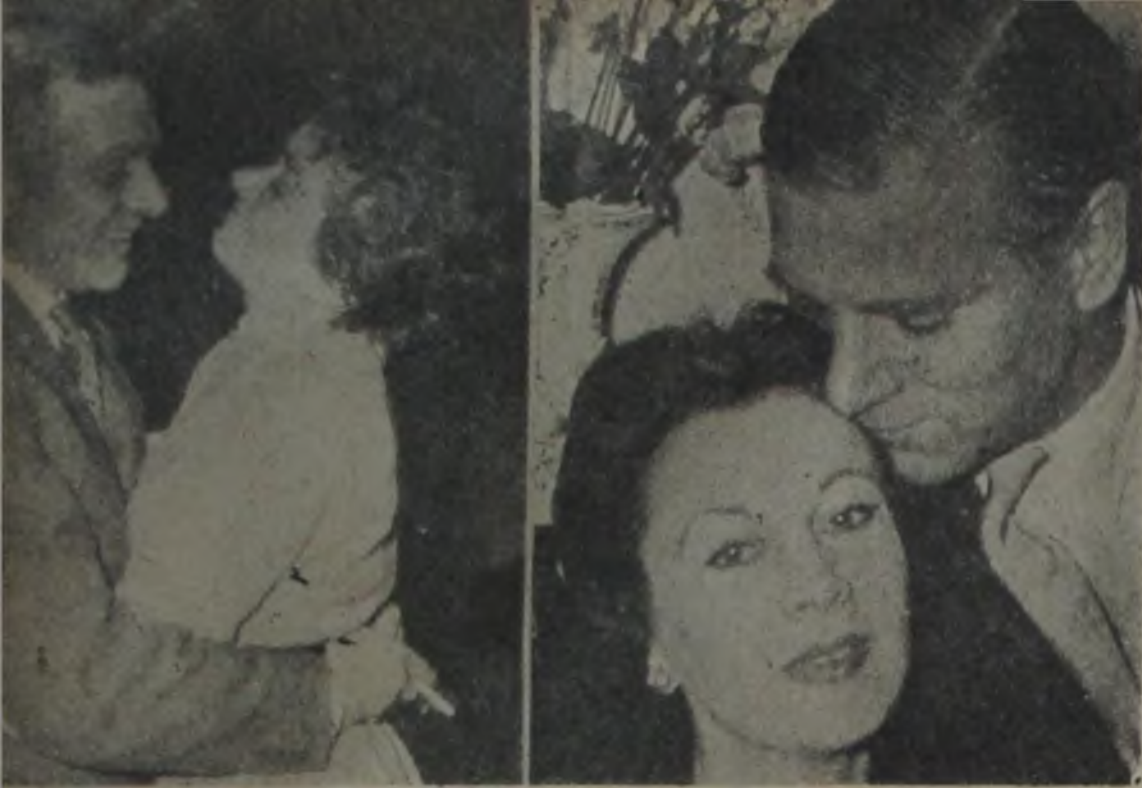
SIR LAURENCE OLIVIER — Yirmibeş yıllık karısı Vivien Leigh'den boşanıp, genç aktris Joan Plowright'le evlendi.