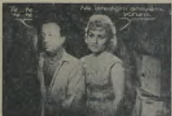
Yeni bir... Singer-Avcuları... Günümüzün... Yeni... Tutulmuş... Singer-Avcuları... Yeni... Yeni...