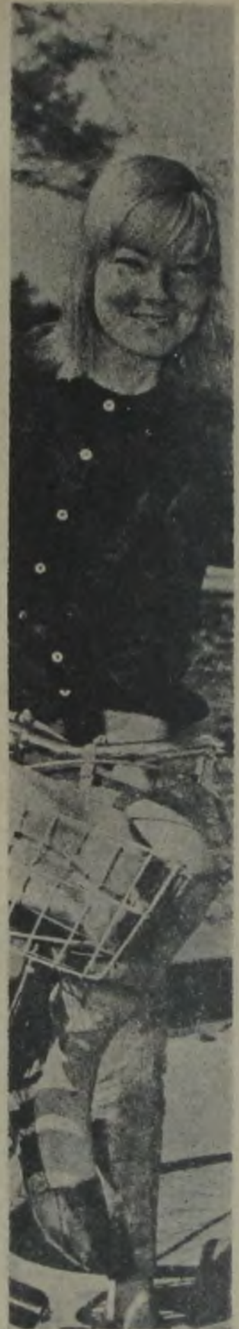
MAY BRITT — Kendisini sevenleri sukutuhayale uğrattı.

Bütün olanlara rağmen, ne evlendikleri günün tarihi olan 13, ne de başka bir şey onların huzurunu kaçırmıyor. Tek sıkıntıları, May'in İngiltere'ye geldiği ilk günlerde kötü bir gribe yakalanmasıdır.