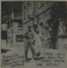
Yeni bir... Singer-Avcuları... Günümüzün... Yeni... Tutulmuş... Singer-Avcuları... Yeni... Yeni...