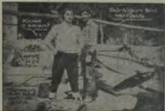
Yeni bir... Singer-Avcuları... Günümüzün... Yeni... Tutulmuş... Singer-Avcuları... Yeni... Yeni...