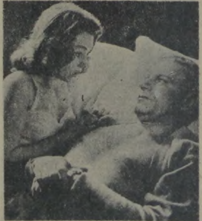
SON FILMİ — Beyaz perdenin asilzadesi son filminde, Shirley Ann Field ile beraber.

Laurence Olivier, genç sevgilisiyle evlendi. Böylece, kuvvetle arzuladığı bir şeyi tatbik etmiş oluyor,