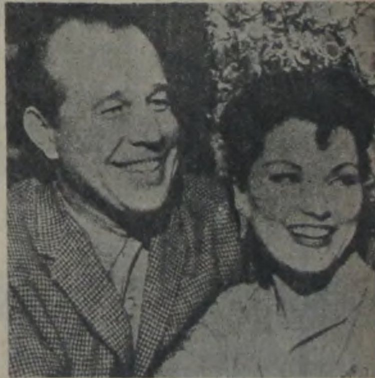
DEBRA PAGET — Son kocası Budd Boetticher ile beraber.