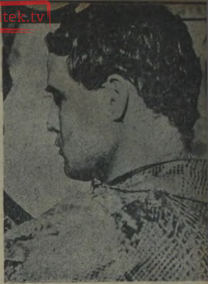
MARLON BRANDO — Yılan Derü Adam.

Dünyanın en büyük film sitesi Hollywood gün geçtikçe en iyi elemanlarını kaybetmektedir. Amerikan vergi sisteminin artist kazançları üzerinde yüzde 60 ilâ 90'ı bulan vergiler tahakkuk ettirilmesinden şikâyet eden meşhur sanatçılar, soluğu Avrupa stüdyolarında almaktadırlar. Meselâ, karakter sanatçılarında Van Heflin birkaç senedenberi Amerika'da film çevirme-