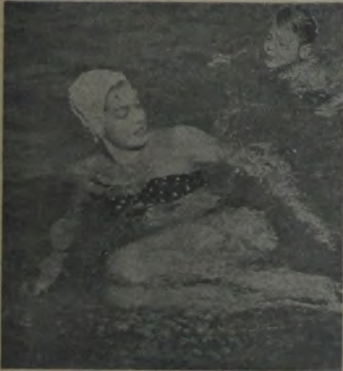
ESTHER WILLIAMS — Yüzmenin sıhhat için faydalı olduğunu söylüyor.

"Colbert Kanunu" diyorum. Vücudu muhafaza edebilmek, yağ bağlamamak için tek şart, makul bir şekilde yemek yemesini bilmektir. Perhiz yapmayın demek istemiyorum. Ama yarım kilo vermek için kendinizi açlığa mahkûm ediyorsanız, hiç durmayın ve yakınlarınızın sizi affetmesi için dua edin. Zira açlıkla verilecek bir kilonun altında binlerce kalb kırıklığına sebep olabilirsiniz. Hattâ bu evlilikinize bile tesir eder.