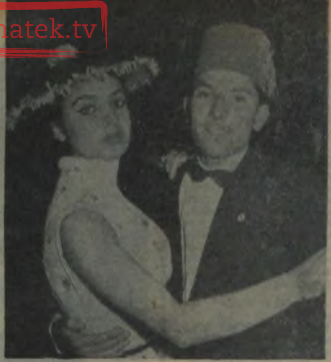
NUR SABUNCU — "Tablodaki Adam" da çok muvaffak olmuştu...