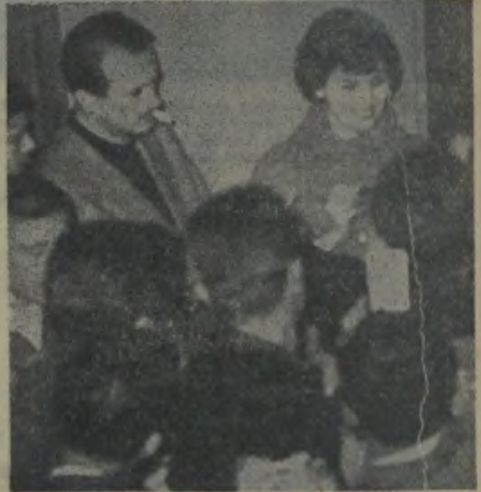
YİNE BERABERLER — Türk sinemasının beğenilen çiftlerinden Sezer Sezin ile Kenan Artun, Pazartesi gecesi ŞAN Sinemasında yapılan "Rüzgâr Zehra" nın prömiyerinde hayranlarına imza dağıtıyorlar.