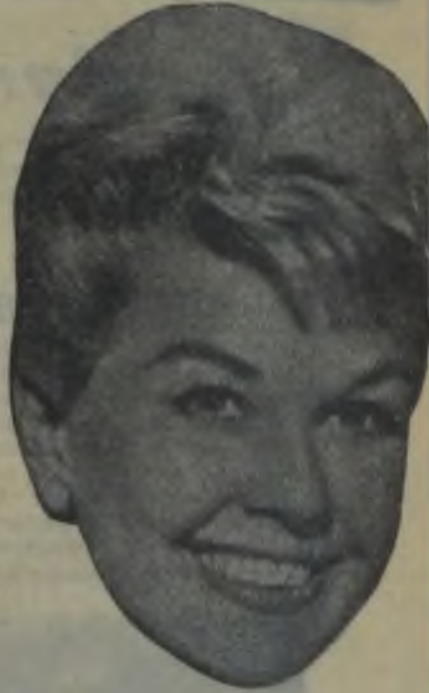
DORIS DAY — Eğer zinde ve sıhhatli kalmak istiyorsanız adalelerinizin gerilmesi sağlayınız.

Birçok kimse, ideal ölçülerle doğmadıkları için, kendilerini tabiat tarafından aldatılmış hissederler. Oysa bir vücudun güzel olup güzel muhafaza edilebilmesi sadece uzun bir ça-