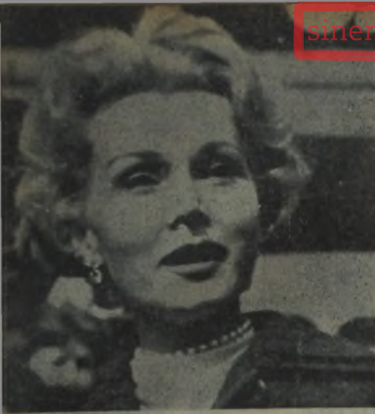
ZSA ZSA GABOR — Kadınlar asla zayıflamamalıdır diyor.