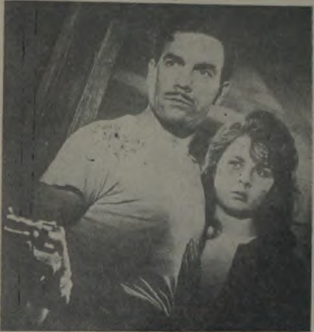
Ayhan Işık ve Fatma Girik «Ölüm peşimizde» de

«Ölüm Peşimizde», genellikle, ilerdeki «Güneş Doğmasını», «Bire On vardı», «Kanun Karşısında» gibi filmlerin şemasını ve trafigini çizen bir prototip, bir örnektir. Bu dört filmin her birinde müşterek noktalar, müşterek noktalar, müşterek durumlar mevcuttur: Suçsuz oldukları takdirde bir cinayet olayına karışan dürüst gençler, bunları kurtarmak için onlarla birlikte mücadele eden, tehlikeye atılan kızlar, bu gençlerin başına belâ