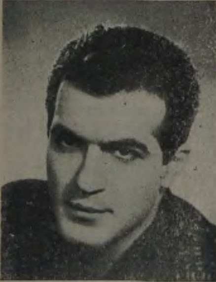
Fikret Hakan, Mevsimin en başarılı erkek oyuncusu

Akad'ın yönetiminde «Beyaz Mendil» de ilk büyük