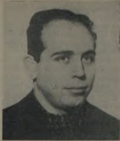
Halit Refiğ «Rejisör olarak sinemaya ilk uyguladığım eser

— Aşağı yukarı... Romanın yazıldığı tarihten bu zamana kadar geçen 65 yıl içinde Türkiyede siyasi ve sosyal hayattâ bir çok değişmelere rağmen (1908 hürriyetin ilânı, 1923 Cumhuriyetin ilânı, 1945 demokrasiye geçiş, 1960 27 Mayıs devrimleri) ekonomik yapıya bağlı birey dramında hiçbir değişiklik olmamıştır... Bu sebeble de «KIRIK HAYATLAR» ın günümüze aktarılması zorluğu diye bir fikir söz konusu olamaz.