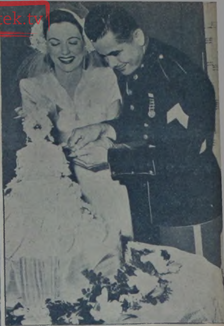
Yukarıda solda: Lana Turner, kocası Steve Crane ve yeni doğan kızları Cheryl. Yukarıda Eleanor Powell ile Glenn Ford nihayet evlendiler. Sağda: Bir sende altı film çevirmek suretile müt-hiş bir rekor tesis eden dil-ber Maria Montez.