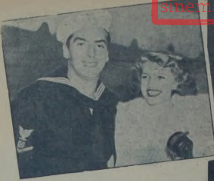
Yukarıda: Amerikan sahil muhafaza kuvvetlerinde er, Victor Mature. Rita Hayworth'un yanından ayrılmaz olmuştur. İzinlerini de onunla beraber geçirirdi.