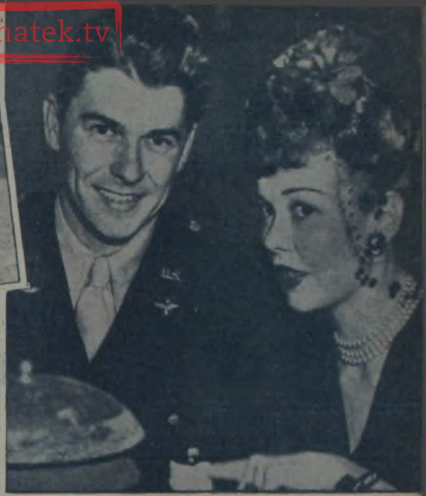
Yukarıda: Amerikan hava kuvvetlerinde teğmen Ronald Reagan, izinlerini daima karısıyla baş başa geçiriyor. Solda: izni biten Robert Taylor, karısı Barbara Stanwyck'ten ayrılarak, bahriye havacılığındaki teğmenlik vazifesinin başına koyuyor. Aşağıda, deniz eri Henry Fonda, izin günlerini «Immortal Sergeant» filminde beraber oynadığı güzel Maureen O'Hara ile baş başa geçiriyor.