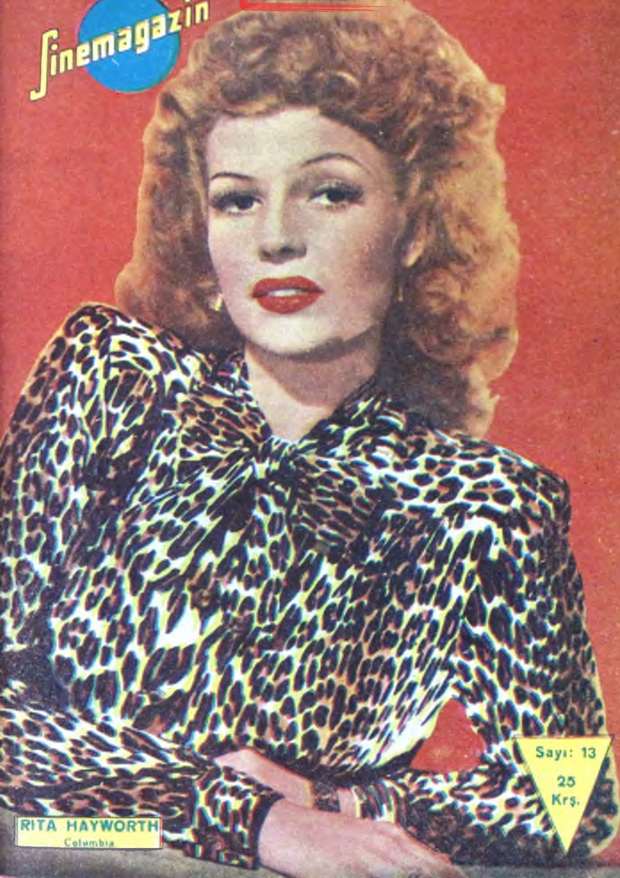
RITA HAYWORTH Columbia