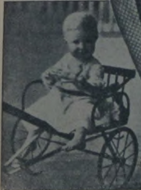
Ginger Rogers 1 yaşında..

Aradan geçen zaman içinde, Ginger'in hayatındaki değişiklik de lâfi edilmeyecek gibi değildir. Çünkü mes'ut görüldüğü Lew Ayres'ten de ayrılmış, uzun bir zaman dul yaşadıkdan sonra (Arkası 25 de)