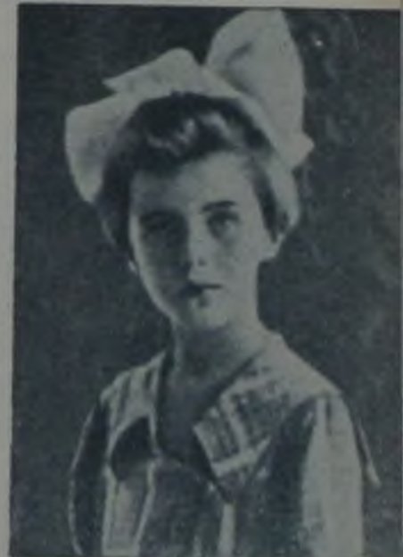
ve dokuz yaşında.