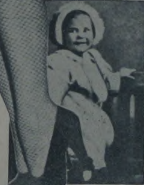
— üç yaşında —