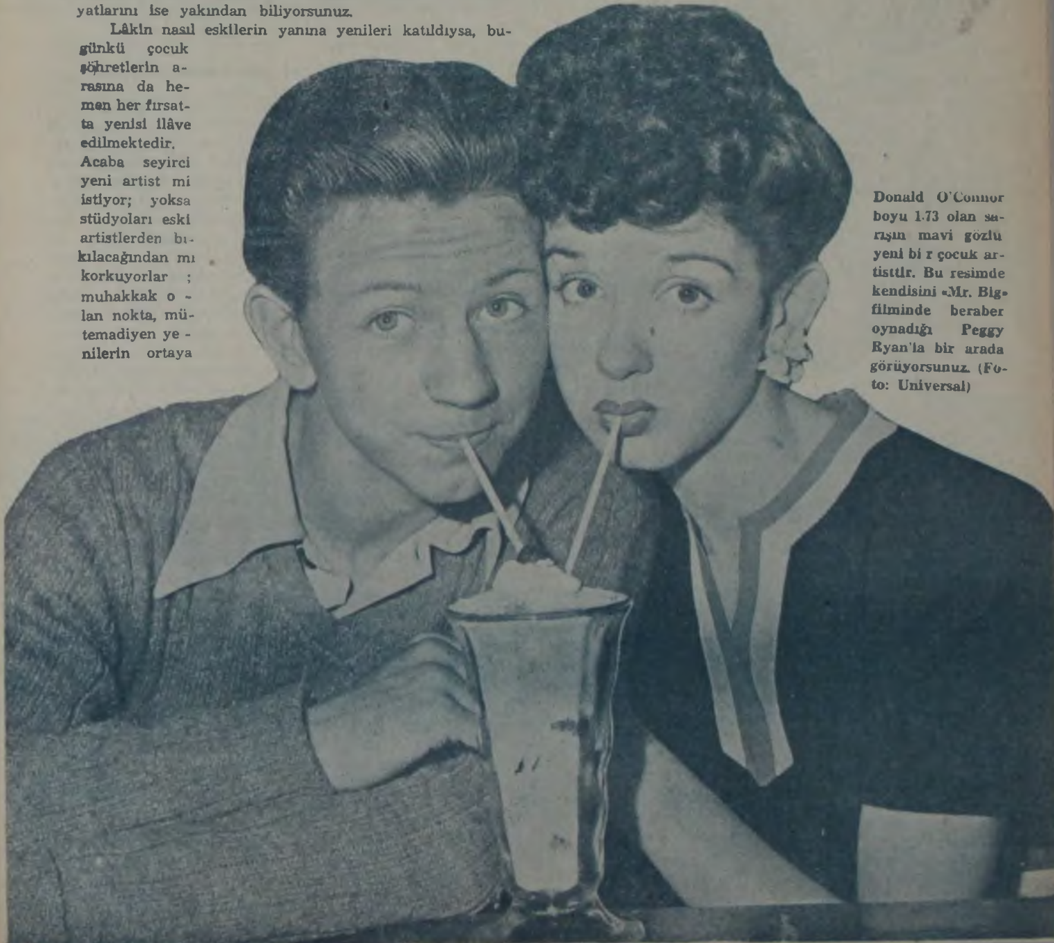
Donald O'Connor boyu 1.73 olan sarışın mavi gözlü yeni bir çocuk artisttir. Bu resimde kendisini «Mr. Big» filminde beraber oynadığı Peggy Ryan'la bir arada görüyorsunuz.

Donald O'Connor'un babası İrlandalı ve annesi de Fransızdır. Onun ana babası da Mickey'inkiler gibi var-yete artisttydiler. Bir zamanlar onlara vodvil kralları ailesi (Arkası 25 inci sayfa)