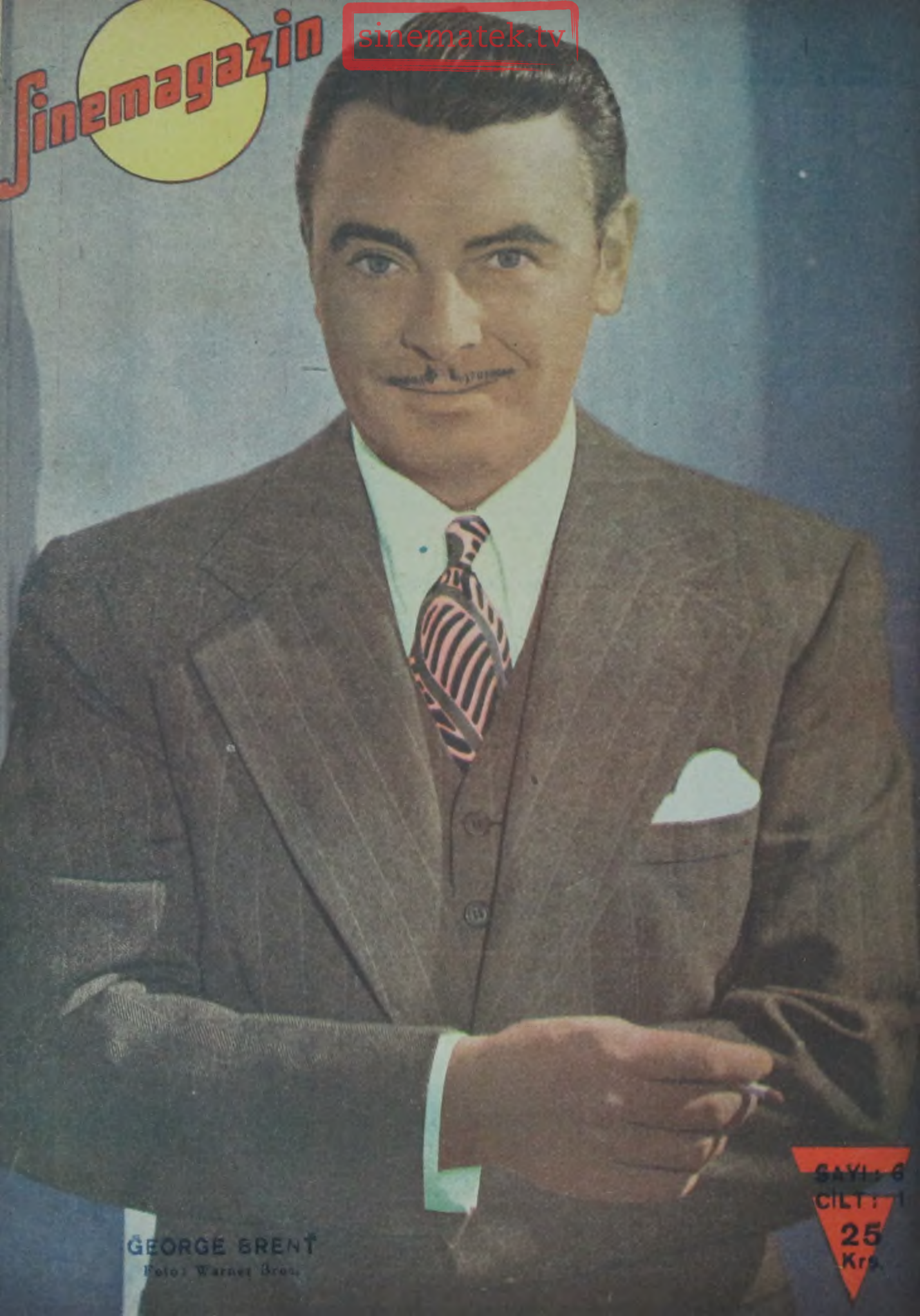
GEORGE BRENT