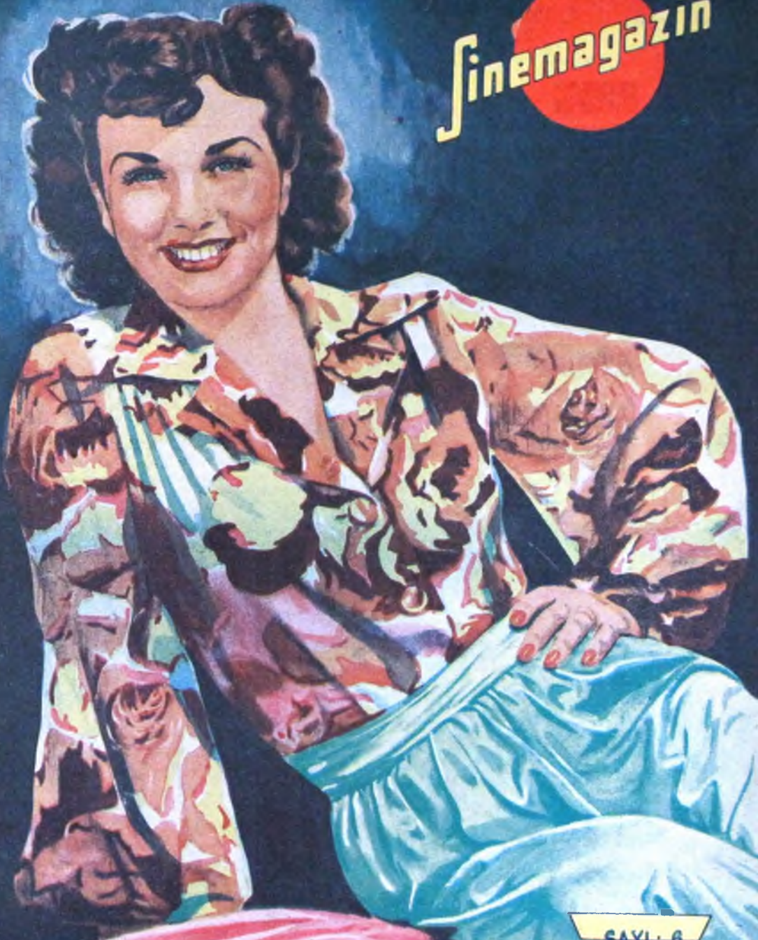
DEANNA DURBIN Universal Artisti