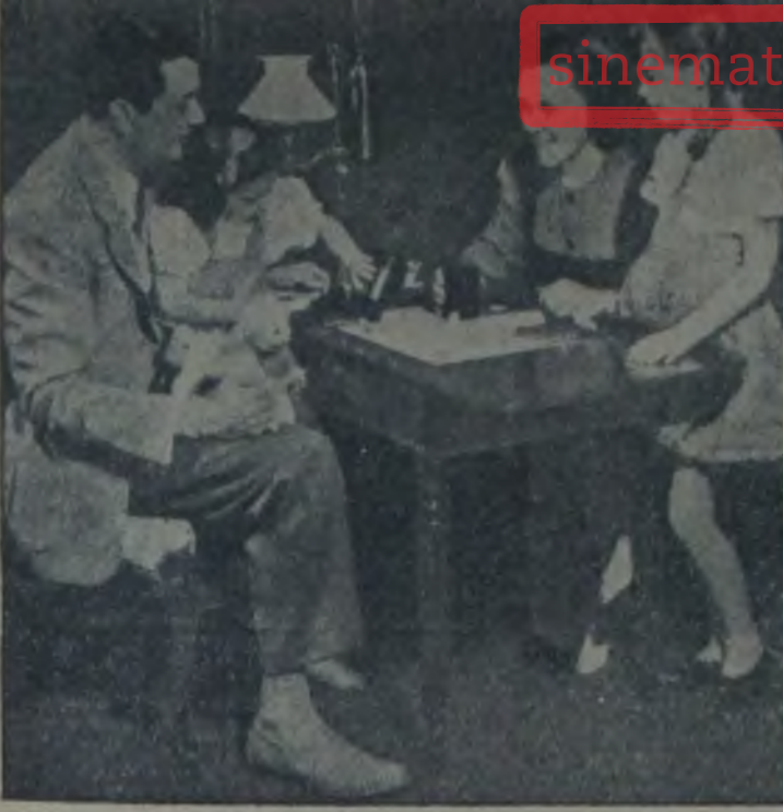
Yukarıda Robert Young ve karısı eski artistlerden Elisabeth Henderson ile kızları Carol Ann ve Barbara Queen. Sağda George Murphy oğlu Dennis'i de kendisi gibi şarkıcı ve müziksiyen yetiştirmeye çok uğraşiyor..