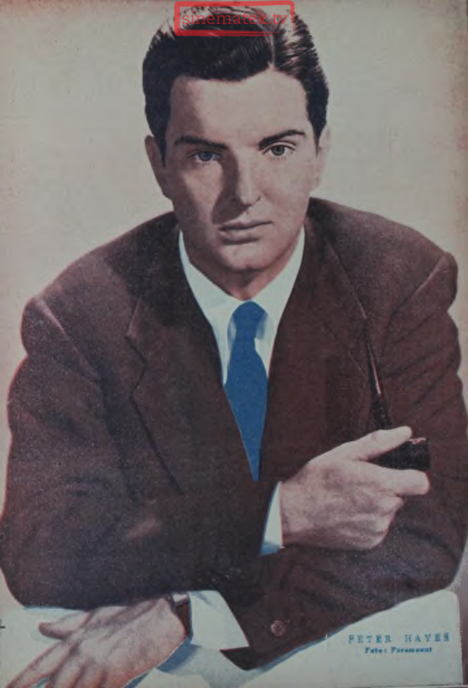
PETER HAYES