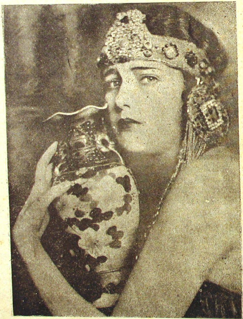
مشهور سینه مایلدیزلرندن : دوریس دین

برنجی سنه — نومرو : ۲ مدیر : محمدرؤف پنجشنبه ، ۱۹ حزیران ۱۳۲۰