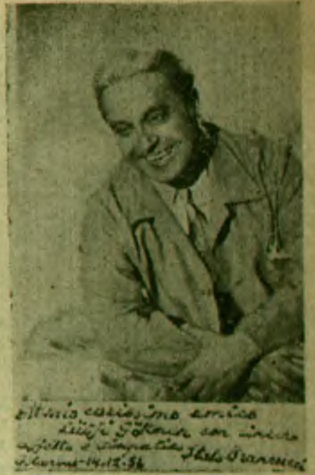
BÜYÜK SANATKAR FAKAT MÜTEVAZİ...

Opera dünyasında takdirle karşılanan bir kaç eseri ve memleketimizde