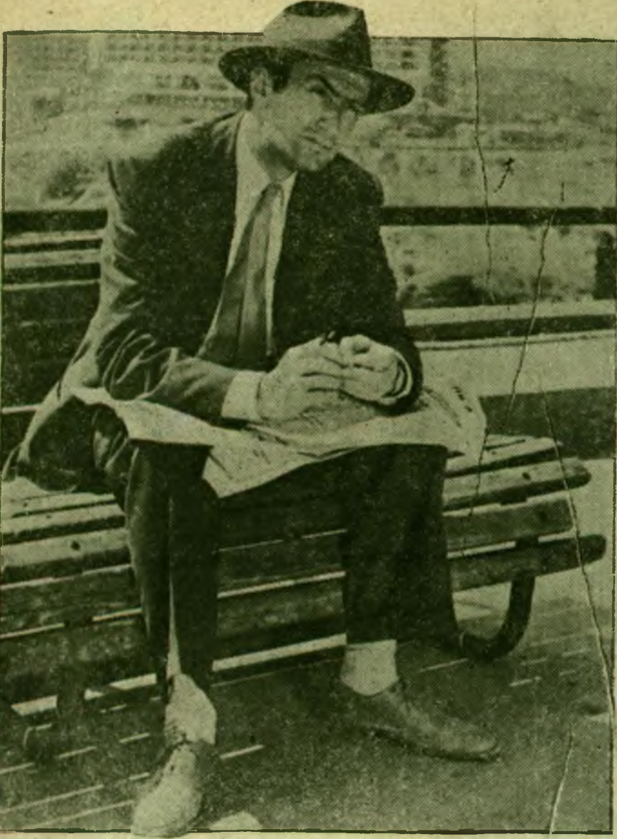
Bu ki kızar ama, işte ondan farksız bir fotoğrafı