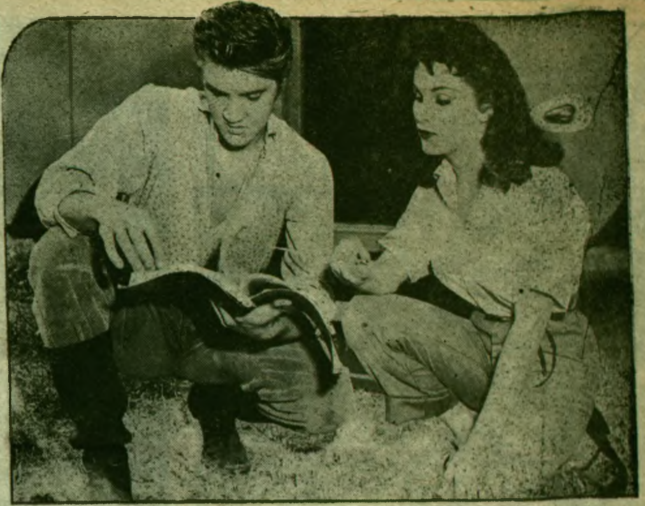
İLK FİLMİ ★ Elvis Presley'in ilk filmi olan, «Love Me Tenders» bitmek üzeredir. Bu filmde Elvis Presley'den başka Richard Egan ve Debra oynamaktadır. Richard Egan filmde Elvis'in kardeşi Debra'da karısı rolündedir. Yukarıdaki resimde Elvis ile Debra Paget'i «Love me Tenders» filminin çekilişi sırasında görüyorsunuz.