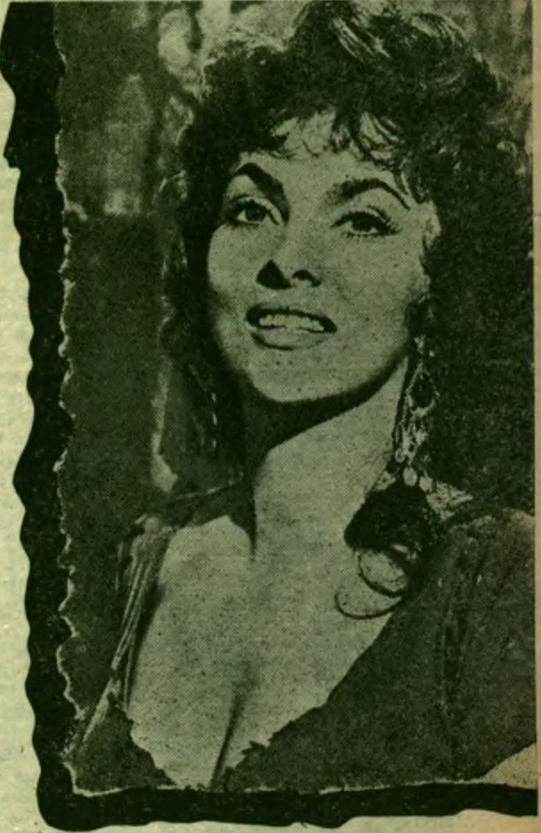
GİNA LOLLOBRİGİDA BÜTÜN ERKEKLERİN SEVGİLİSİ