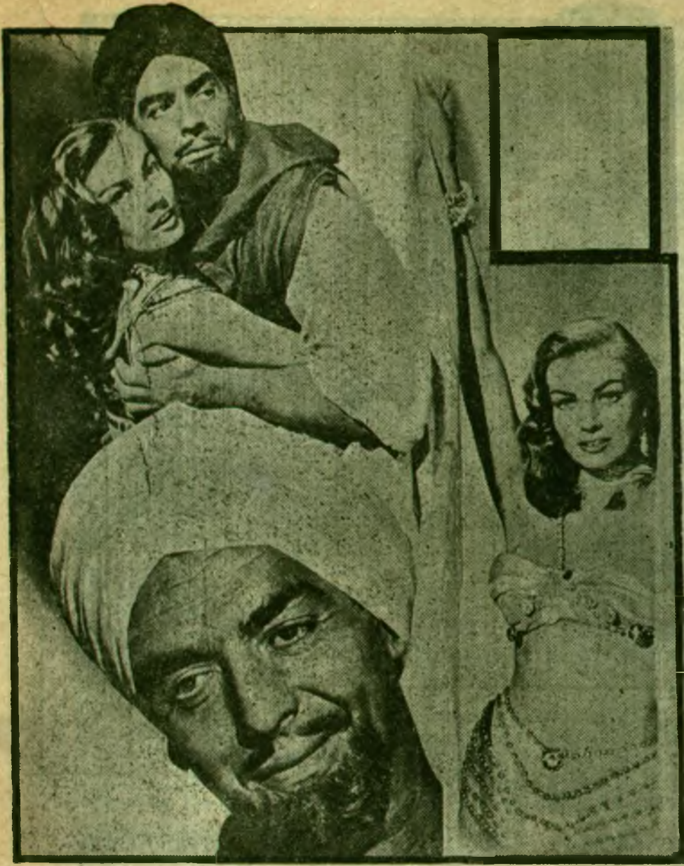
Zarak Han filminden bir sahne

Anita Ekberg ile Victor Matur'un çevirdikleri film