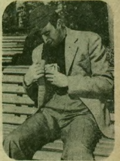
Bülent Oran'ın bir filminden iki 'poz'