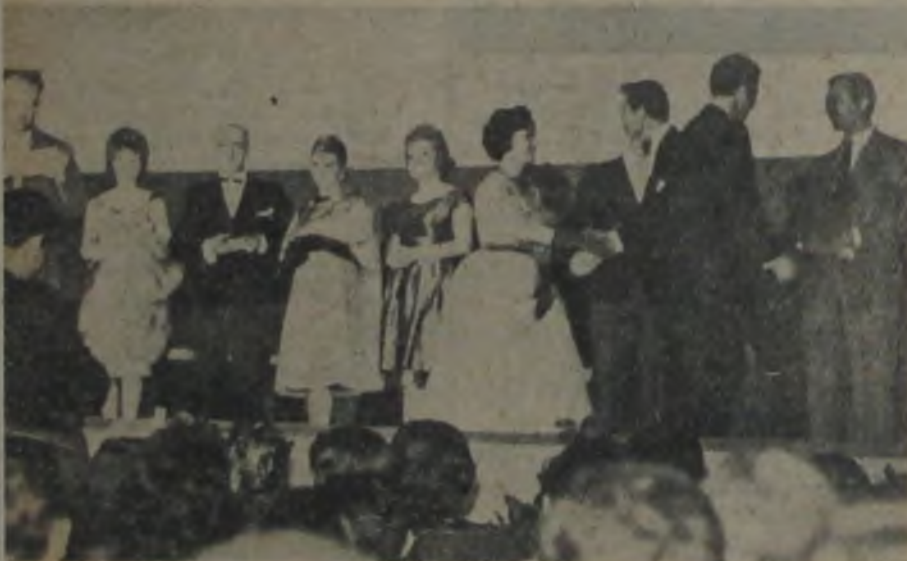
SONUÇLAR İLAN EDİLİYOR ★ İstanbul Valisi Refik Tulga, Türk Filmleri Yarışması'nın sonucunu ilân ederken sahnenin genel görünüşü.

«Aşkolsun vallahi!.. Türkiye'de de gazetecilik epey ilerlemiştir. Bu hâdiseye üzülme-