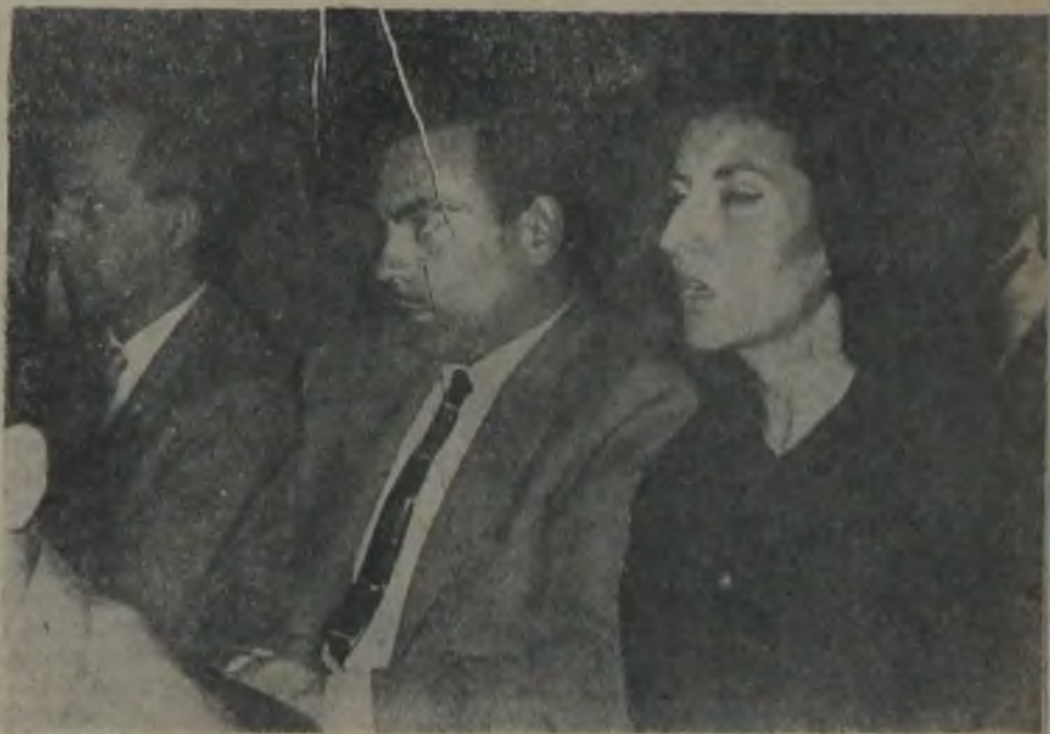
MESHUR FOTOGRAF ★ Türk perdesinin değerli jönü Ayhan Işık ve eşi Gülşen Işık film seyrederken, SİNEMA objektifi faaliyette...