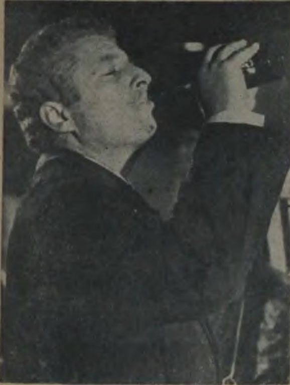
KENAN PARS «İçki!...»