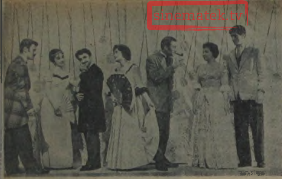
SABIR VE SEBAT Sabreden derviş...