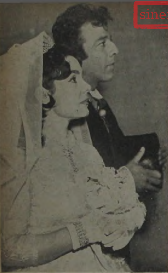
BEKLENMIYEN NİKÂH ★ İki ünlü yıldızın âni nikâhları sürprizle karşılandı...