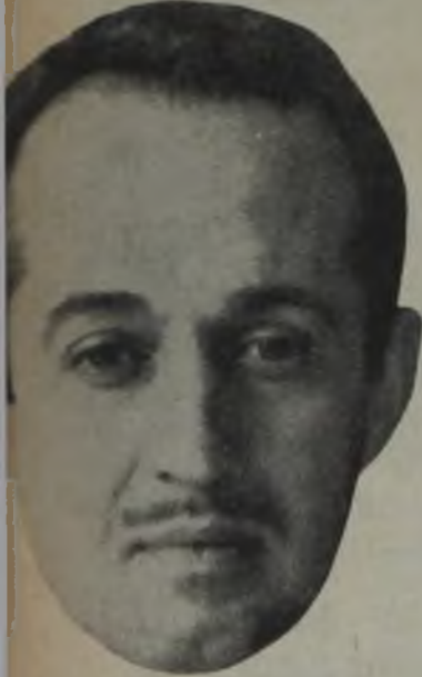
FECRİ EBCIOĞLU Disc-Jockey No. 1

«Ağabey bu kızı tanımiyorum. Acaba hangi ağanın kızı? Vallahi bir görüşte vuruldum. Benden ne isterse ona razıyım.» demişti. Başka bir gurupta ise, gençlerin şöyle dediklerini duydum: «Bu kız bizim köyde olsa çoktan kaçırır-lardı...»