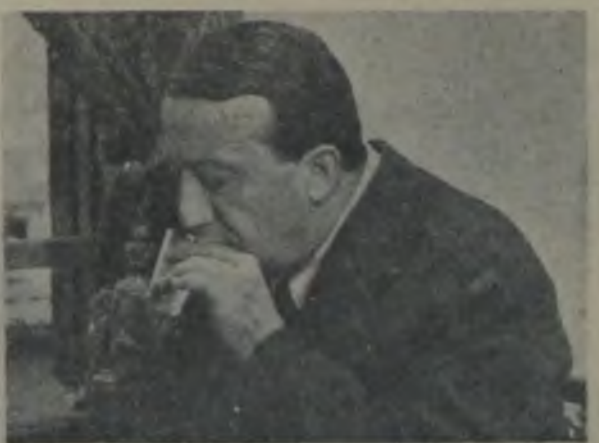
DENİZE İNEN SOKAK Avrupa için film...