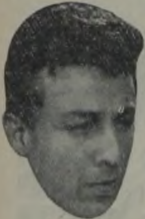
MÜNİR ÖZKUL Sağ ayak!..

Sinema ve Tiyatromuzun kıymetli oyuncusu Ulvi Uraz bâtil itikatlara önem vermeyenlerden. Anketimize cevap