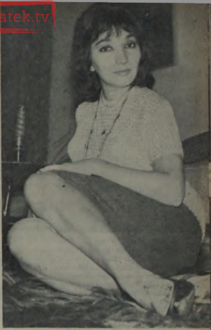
GÜLRİZ SURURL İzmir'de...