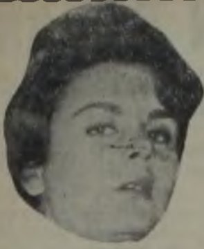
FATMA GİRİK Adak'a inanırım..