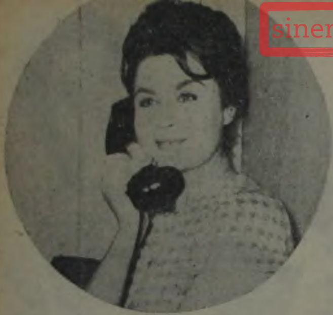
Gür siyah saçlar, uzun siyah kirpikler, yemyeşil, canlı, parlak gözler..

önündeydik. Zile bastım.. Kapı hafifçe aralandı. Genç bir kız bakıyordu. Bizi görünce, döndü ve içeri seslendi: