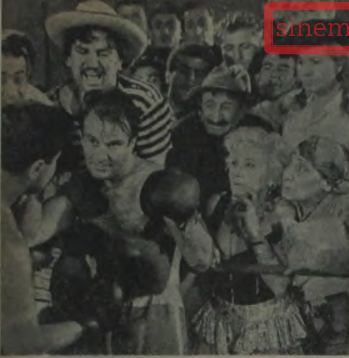
«BEDAVACILAR KIRALI» Gülen gülene!..