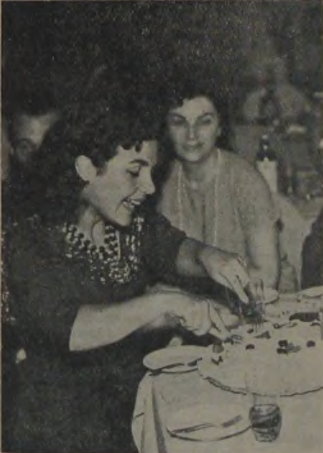
PASTAYI KESERKEN Happy Birth day you!..