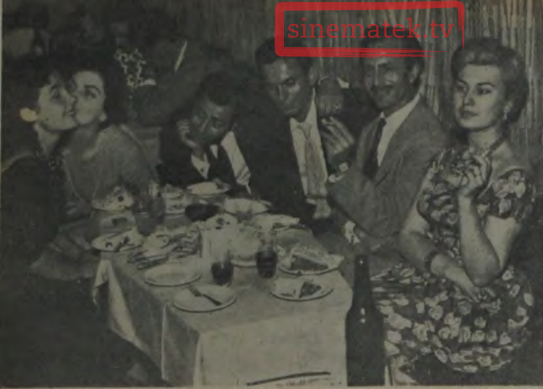
DAVETLİLER ÇATI'DA Bir yıl daha geçti!..