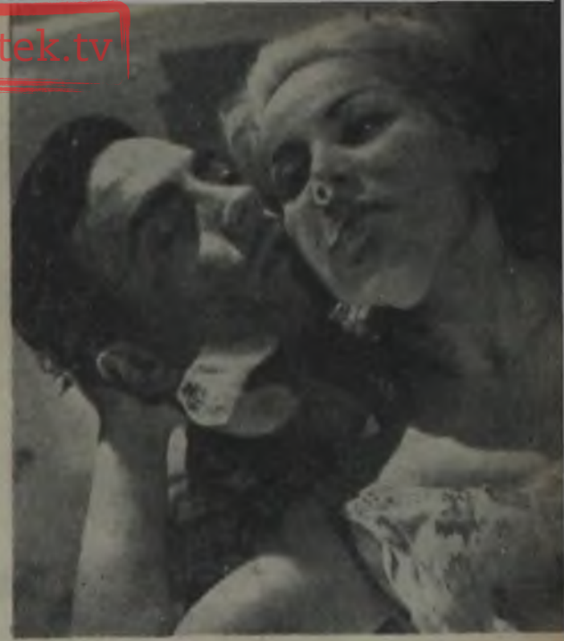
ÖLÜM PEŞİMİZDE Herşey teknik için!..

Hammaldan aktör, futbolcudan rejisör, fotoğraf-