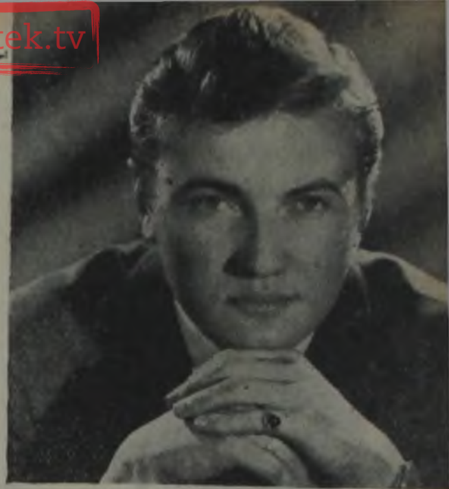
GÖKSEL ARSOY Üzerime ceket iliklemeysin!..

Değerli film ve ses yıldızımız Zeki Müren 13 rakkamının uğursuzluğuna inananlardan... Bu yıldızımız aynı za-