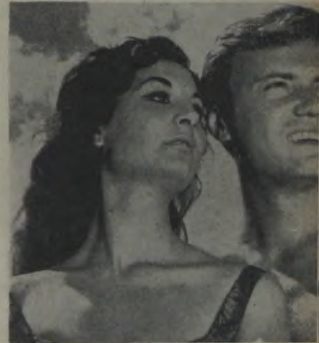
AŞK RÜZGARİ Zararlı neşriyat!..

ren olmuş, toplumu sömüren topluluğa bir el atınca, kafalarında bir senede kaç film yapacaklarını, hangi konularla toplumu istismar edip vurgun vuracaklarını düşünen insanların ne yapacaklarını çok merak ediyorum.