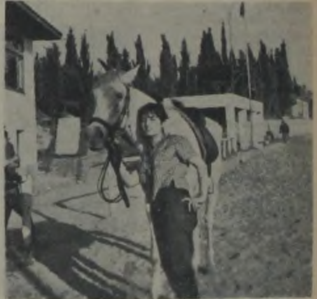
TURKAN ŞORAY Ders başlıyor!..

risimiz birkaç gün evvelsine kadar gününün birkaç saatini Veli Efendi Hipodromunda ata binmekle geçiriyordu. Jokeyliğe karşı büyük bir heves ve istidatı olan Türkân Şoray maalesef, filmin senaryosunun sansürde takılması yüzünden antrenmanlarına son vermek mecburiyetinde kalmıştır.