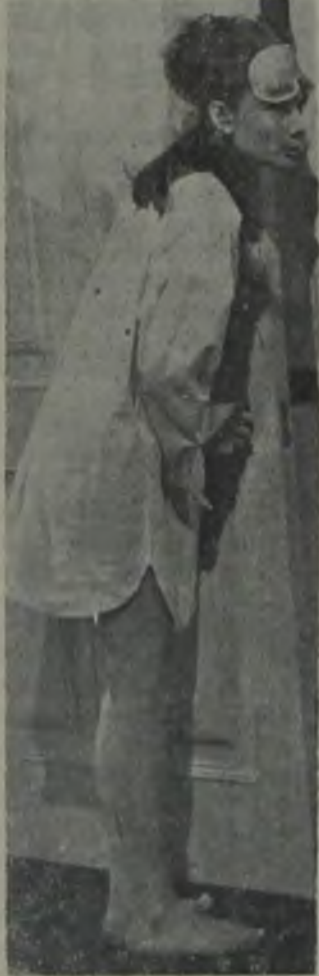
AUDREY HEPBURN — 1. kinci defa hâmile imiş. Doğru ise Mel Ferrer, dördüncü defa baba olacak demektir.

★ Romy Schneider ile Alain Delon, Paris'in meşhur