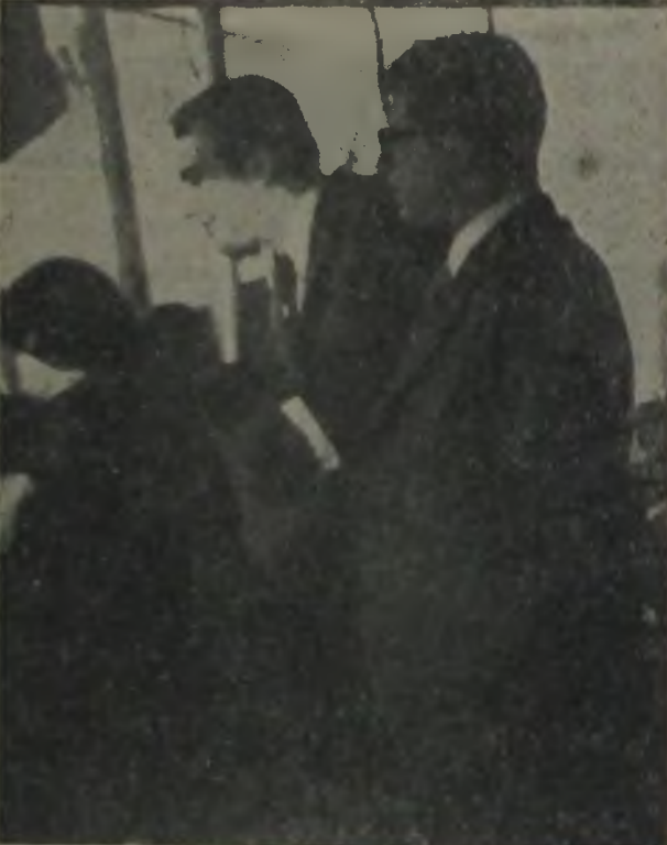
GÜNŞİRAY VAPURDA — Yakışıklı aktör, vapurun güvertesinden İzmir'i seyrediyor.