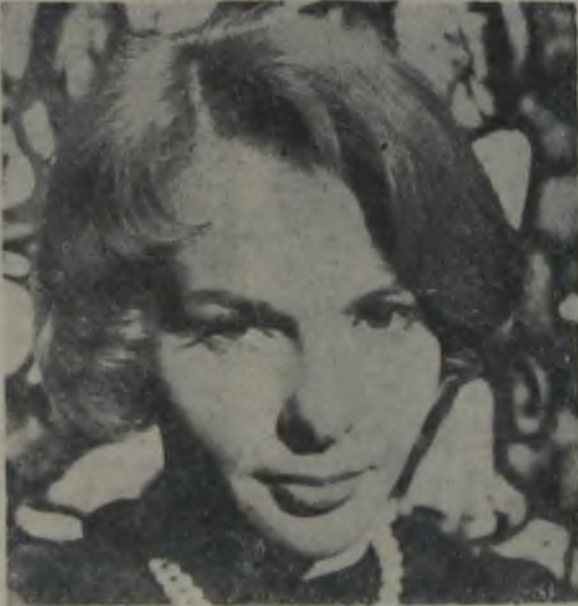
FRANÇOISE ARNOUL Brigitte Bardot değil ki...