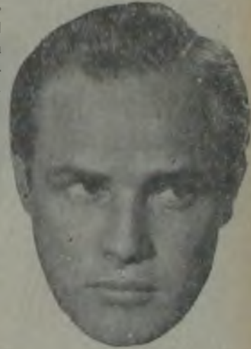
MARLON BRANDO — France Nuyen'le yeniden beraber dolaşması dedikodulara sebep oldu.