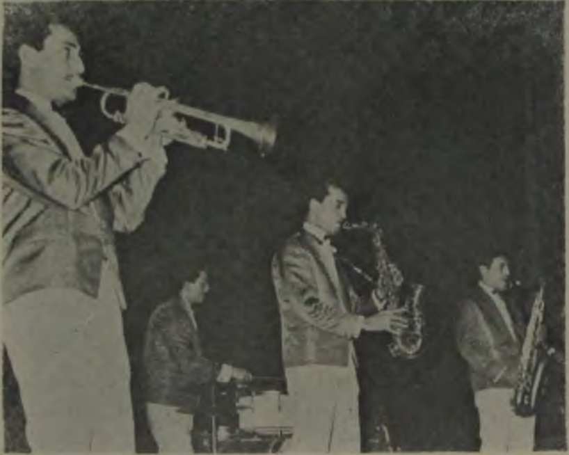
ORKESTRA 6 ★ Kaliteli müzik ve haklı tezahürat.