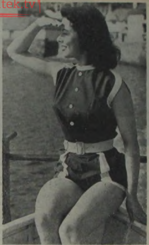
ANNE HEYWOOD — Geçen sezon Howard Keel ile beraber «Korkulu Dalgalar» filminde seyrettiğimiz ve çok beğendiğimiz aktörün bir Amerikan - İngiliz filminde baş rolü alması muhtemel...

Hâlen Anthony Perkins ve Yves Montand'la bir film çevirmekte olan ünlü yıldız Ingrid Bergman, «The Light in the Piazza» adlı kordelâda Rossano