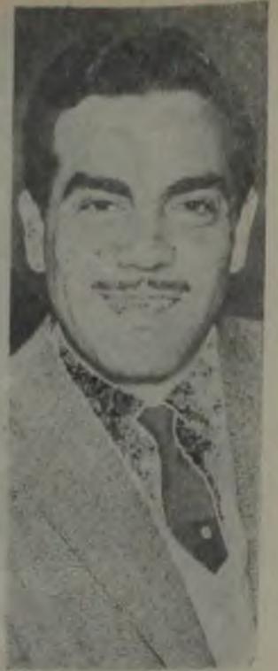
GÖKSEL EVLENDİ Sükresi artacak mı?

Bu konuşmaların neticesini ilerde göreceğiz... Bize