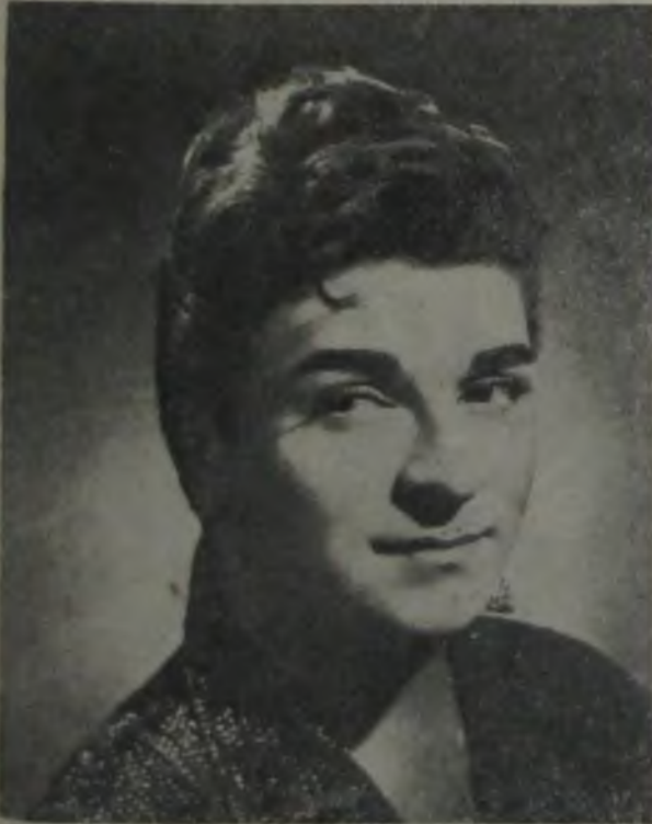
ZEKİ MÜREN Rekor yine onun.