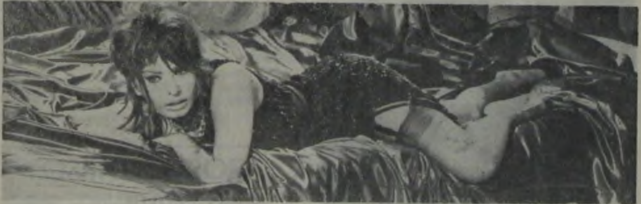
SOPHIA LOREN — Ünlü yıldız, son filmlerinden «Milyoner Kadın» ın bir bölümünde görünüyor...