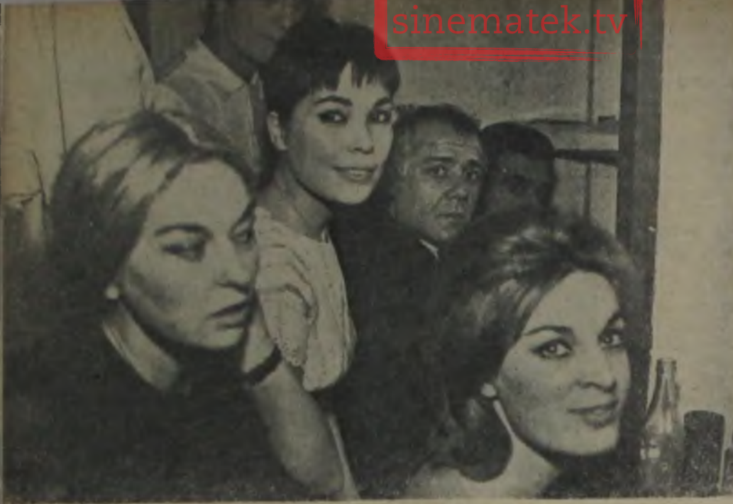
6 DAKIKA VAR — Piyesin başlamasına altı dakika kala, sanatçılar son hazırlıklarını yapıyorlar...