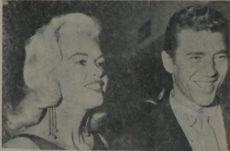
KARI KOCA — Fotoğrafta beraber görülen Jayne Mansfield - Mickey Hargitay çifti, Hollywood'un ideal evlilerinden sayılıyorlar.

Bakalım yakın bir gelecekte, şöhretini kaybetmekte olan Jayne Mansfield, eski durumunu sağlayabilecek mi?