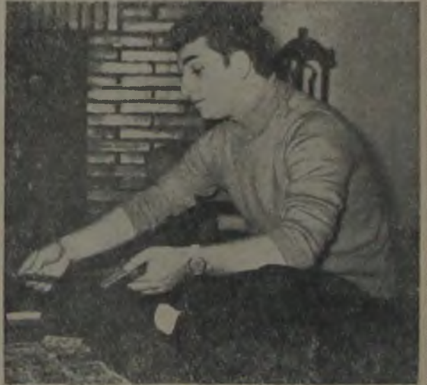
ZEKİ MÜREN Hangi şirkete?

SİNEMA 1961 — Zeki Müren bu sezon, her yıl olduğu gibi yine bir film çevirecektir. H enüz hiçbir şartla anlaşma yapmamıştır.