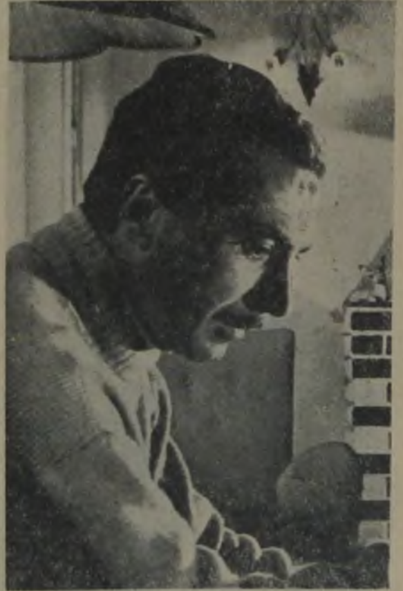
ÖLÜM PEŞİMİZDE — Memduh Ün son filmi «Ölüm Peşimizde» de yarattığı başarılı kompozisyonla Türk Sineması'na yeni bir «kötü adam» kazandırdı.