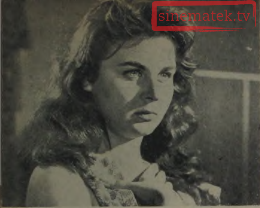
FATMA GIRİK «Aşk güzel bir şeydir...»