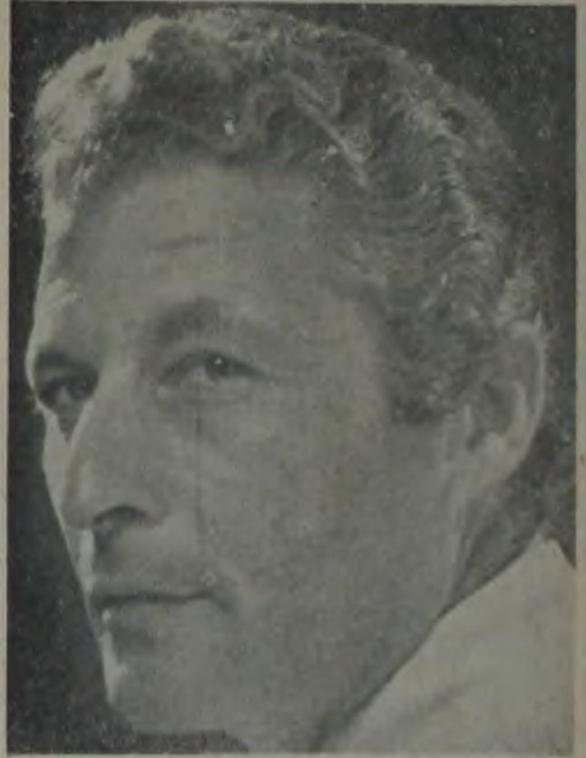
KENAN PARS Ne âlemde?