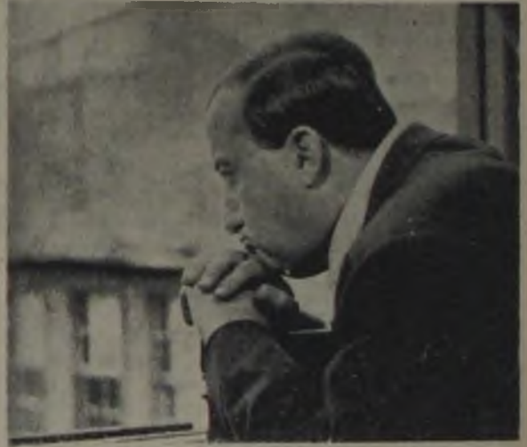
DENİZE İNEN SOKAK ★ Halkın tutmadığı bu film, kritiklerin ilgisini çekiyor. AYŞECİK ŞEYTAN ÇEKİCİ — Atıf Yılmaz'ın kozu.