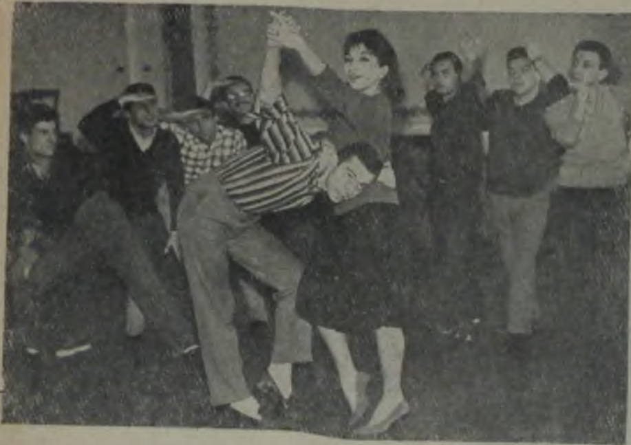
BİRİNCİ PERDE FINALI ★ Ufukta görünen bir gemi mi?... Hayır, Paris!...