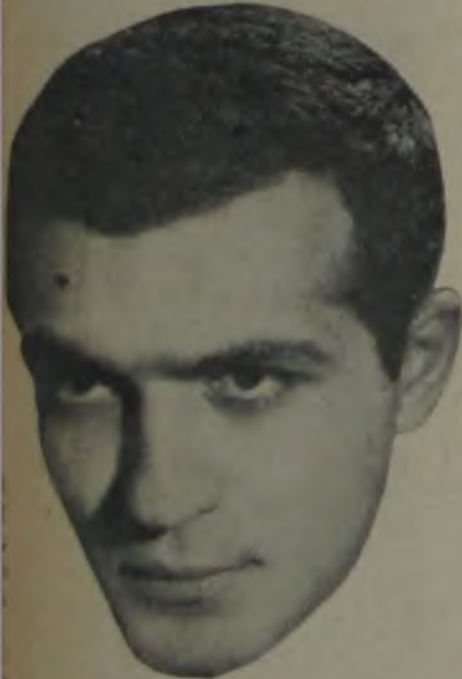
FIKRET HAKAN «İşim çok...»