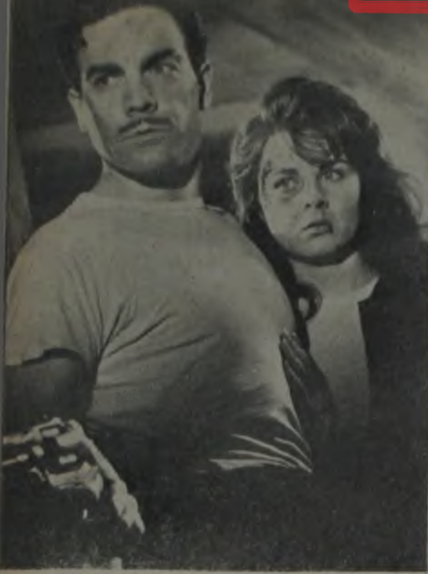
ÖLÜM PEŞİMİZDE ve NAMUS UĞRUNA ★ Her iki film de başarılı rejî çalışmalarıyla film kritiklerinin listelerine girdiler...