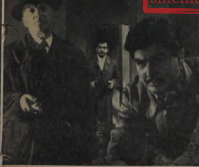
KANLI FİRAR ★ Orhan Elmas'ın geçen sezon seyrettiğimiz bu filmi de listede