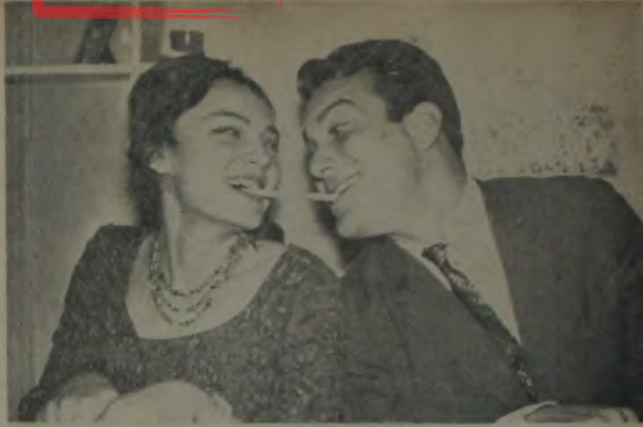
AYRILIYORLAR — Sinemamızın sevilen yıldızı Orhan Günşiray, karısından ayrılıyor. Yukarıdaki resimde karı - kocayı mes'ut günlerinde görüyorsunuz.

Geçtiğimiz hafta içinde başlayan İstanbul Belediyesi Sanat Festivali'nin Türk Filmleri Yarışması'na da salı ak-