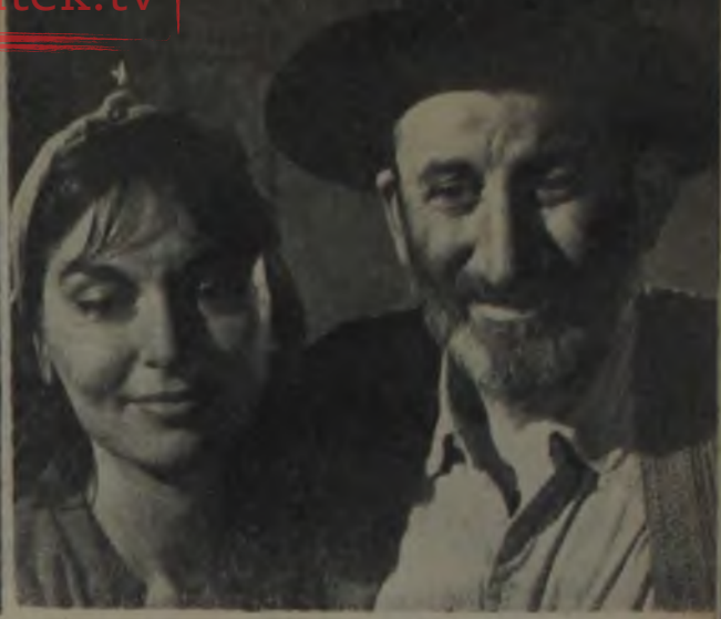
KIRIK ÇANAKLAR ★ Memduh Ün'ün başarılı filmi, hikâyesi ve tekniğiyle kuvvetli bir aday...