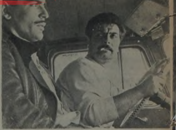
GECELERİN ÖTESİ ★ Metin Erksan'ın bu kordelâsı festivalin favorilerinden...