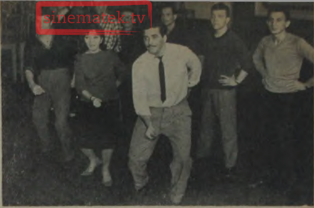
BİR, İKİ, ÜÇ... ★ Küçük Sahne'nin genç oyuncularını dansa başlıyor.

Daha sokağa girdiğimiz an, müzik ve şarkı sesleriyle kulaklarımız doldu. «Paris, güzel şehir.. İşte Pigall.. Madlen Kilisesi.. Şarkı Paris'i ve hususiyetlerini terennüm ediyor ve insanı Fransanın güzel başşehrine, Sen kıyılarına götürüyor. Bir an, daldığımız rüyadan uyanıp etrafımıza bakıyoruz. Tepebaşı ile İstiklâl caddesini birleştiren ana sokaklardan biri burası!. Sesin geldiği binayı tâyin etmeye çalışıyoruz. Mermer bir binanın üçüncü katı. İtalyan opera cemiyeti... Demekki Paris'te değilmiz, İstanbulun ortasında, Beyoğlunun göbeğinde prova yapılan bir salona dalıyoruz. Şimdilik