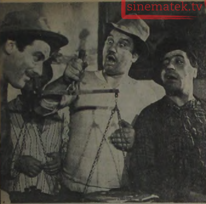
«DOLANDIRICILAR ŞAHI» Büyük jüri beğenebilir...