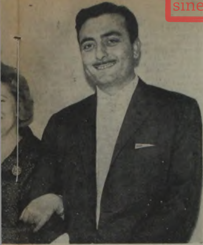
Özdemir Birsal SINEMA objektifine poz veriyorlar...