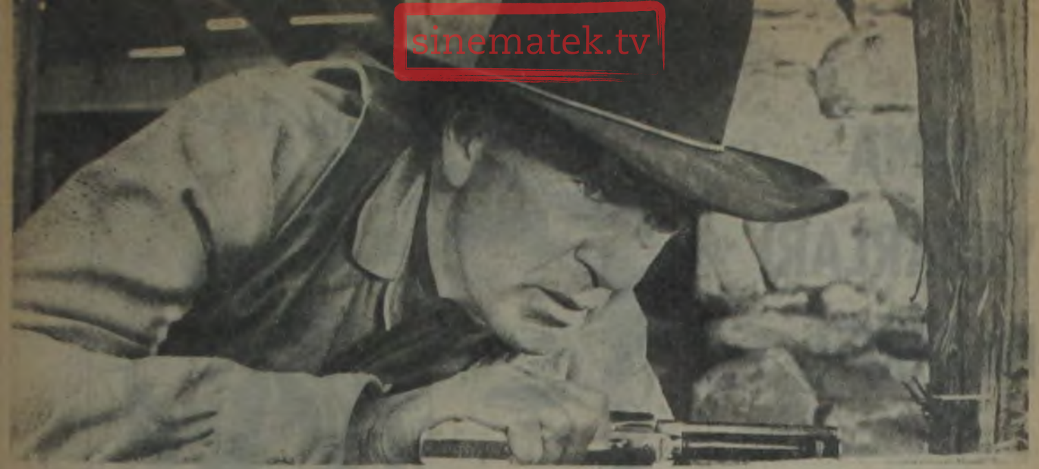
GARY COOPER Kansere de bir kurşun!...