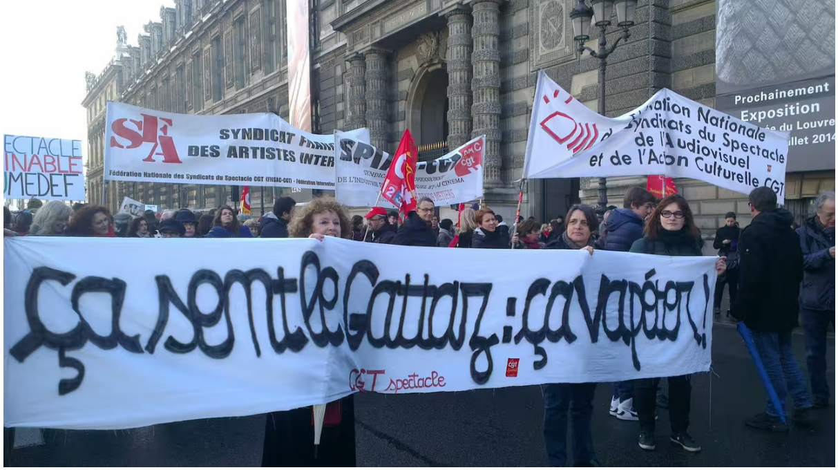
CGT Gösteri Sanatları Federasyonu'nun Fransız İşverenler Federasyonu MEDEF'in genel merkezine yaptığı yürüyüşten bir enstantane

Kısacası, 1948 sübvansiyon yasası, CNC'nin kurulması ve aralıklı çalışanlar sistemi — kurtuluştan doğan ve Fransız kültürel direncinin hâlâ kalbinde yer alan bu özgün modelin— ayaklarını oluşturmaktadır.