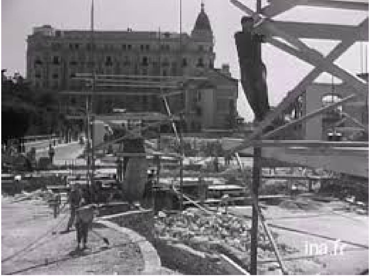
Cannes FF Sinema Sarayının Yapımı

gösterimlere hazır halde teslim edildi. Bu şantiye gerçek bir simgesel savaş sahnesine, Cannes halkının festivalleri için verdiği mücadeleye dönüştü. İşçiler zamanlarını bağışladı; malzemeler kıttı ve bir kısmı oradan buradan "ödünç alındı" (kamyonun kasasından düştü, deniliyordu). Kentin terzihaneleri salonu süslemek ve perde dikmek için seferber oldu.