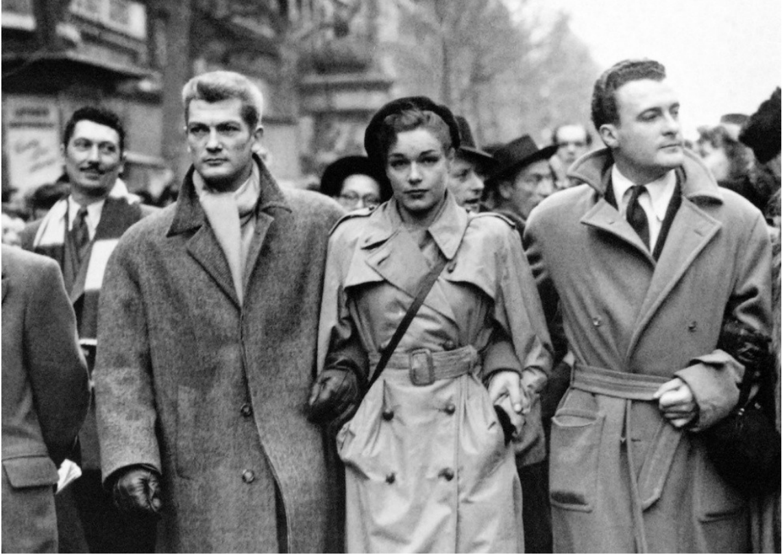
Soldan sağa: Fransız oyuncular Jean Marais, Simone Signoret ve Roger Pigaut, 4 Ocak 1948'de Paris'te, "Blum-Byrnes anlaşması" olarak bilinen düzenlemenin ardından Fransız sinema perdelerinin Amerikan filmlerinin istilasına uğramasını protesto eden gösteride.

Her şey 1947'de Cannes'da başladı; festival bu protestonun odak noktasına dönüştü. Ardından Ocak 1948'de Paris'te Fransız film endüstrisinin büyük gösterisi gerçekleşti: sanatçıları, teknisyenleri ve aktivistleri bir araya getiren bir yürüyüş, geniş bir kamuoyu kesimini kazandı. Hareket, Komünistlerin sevgili "seyirci-yurttaş"(spectator-citoyen) 8 geleneğine ve sinema kulüplerine yaslandı: etkin, eleştirel ve siyasi açıdan angaje bir izleyici. Bu kampanya sayesinde film endüstrisi yalnızca kamuoyunu değil yasama ve yürütme organlarını da safına çekebildi.