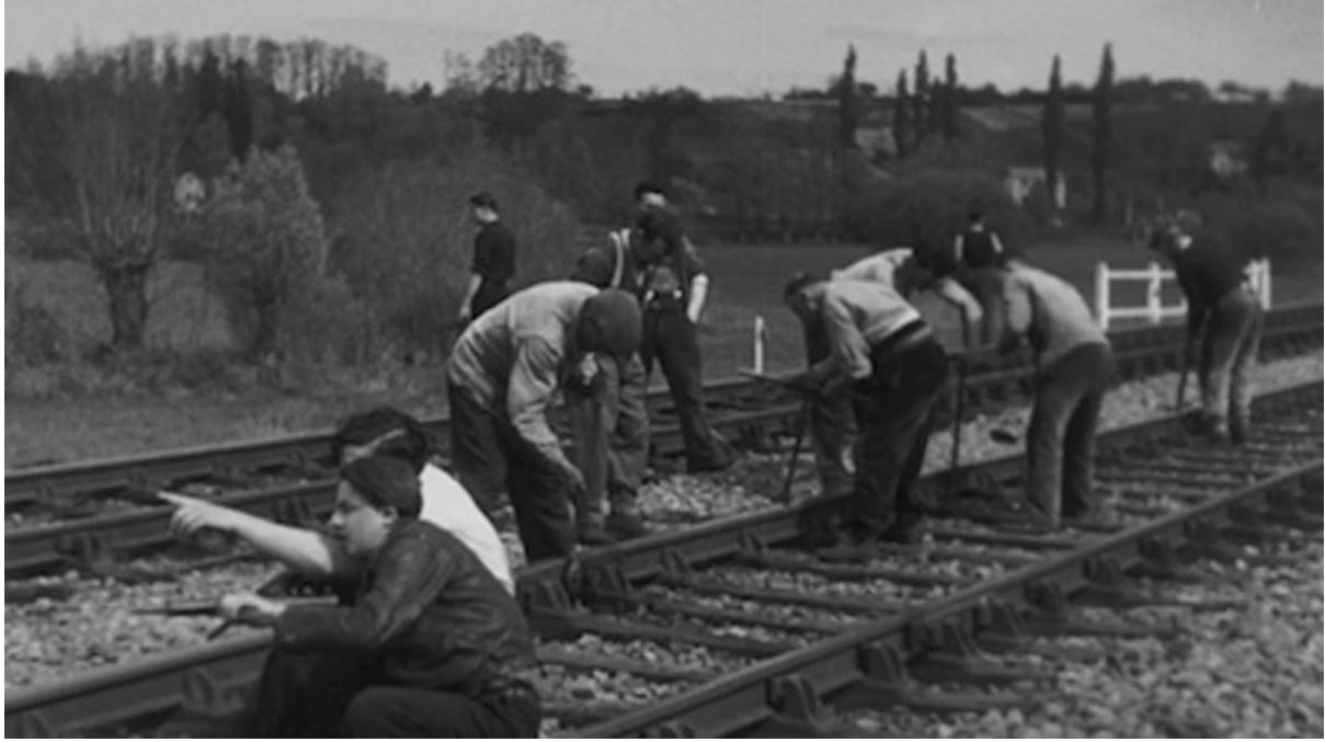
Le Bataille du Rail (Demiryolu Savaşı, René Clément, 1946)

Genel Fransız Sinema Kooperatifi tarafından üretilen La Bataille du rail (Demiryolu Savaşı, René Clément, 1946) filmi, burada iki büyük ödül kazandı. Bu güçlü bir mesajdı: halkın sineması, Direniş'in sineması Cannes'da zafer kazanmıştı. Dolayısıyla 1946'daki bağlam son derece elverişliydi: sol eğilimli bir kent, Komünist yönetimli bir departman, güçlü bir CGT ve hâlâ PCF'li bakanları barındıran ulusal bir hükümet.